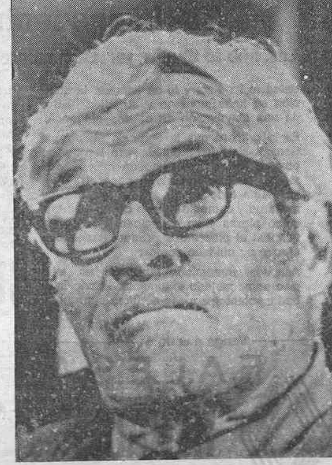
LOS ANGELES.—William Wellman, en foto de archivo de 1974, es de la Aviación: que fue en la Primera Guerra Mundial y que luego se dedicó a la producción cinematográfica, dirigiendo 88 películas, falleció el pasado día 9, a los 79 años de edad.