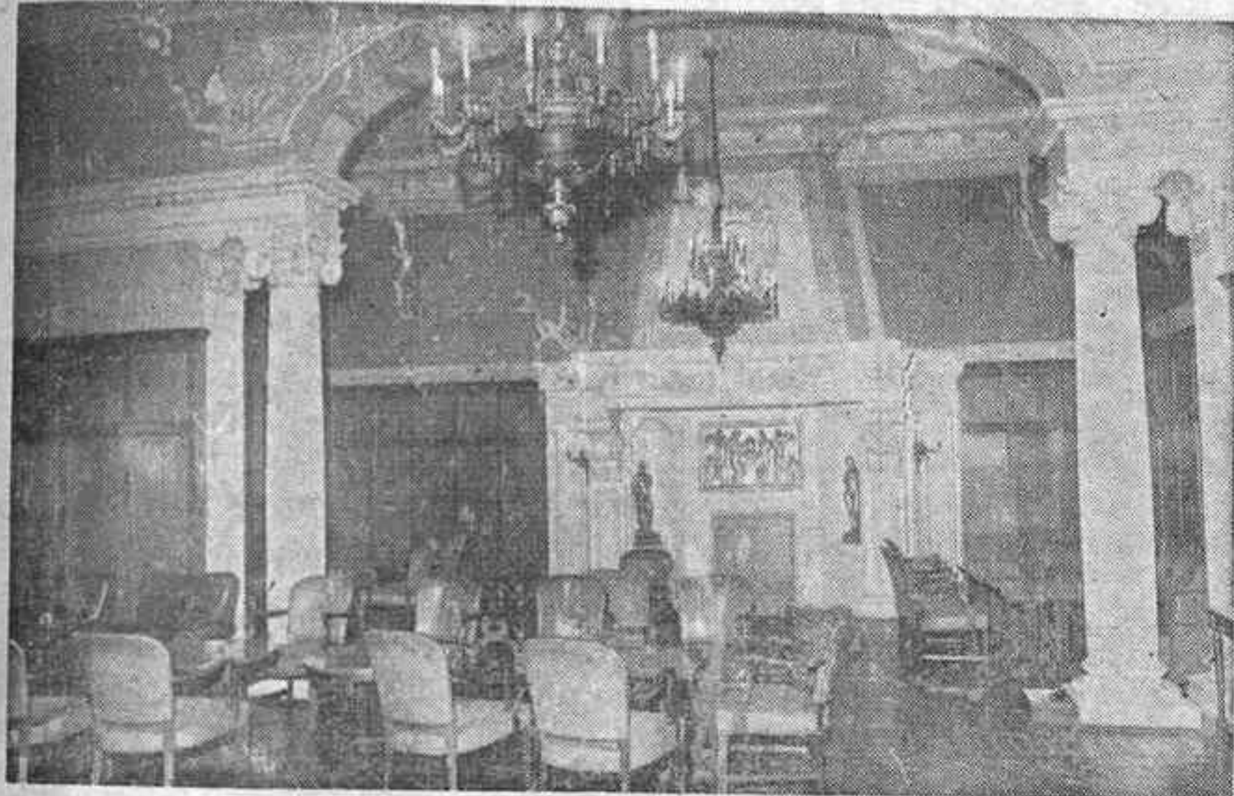
Un rincón clásico de las instalaciones del Casino, en el salón recaente a la calle Enmedio y plaza del Caudillo, Es, como si dijéramos, el salón de más sabor.

El primer forjador de la actual sociedad, Casino Antiguo, fue don Francisco Giner Feliu, barón de Benicasim, quien presentó la correspondiente solicitud para crear una sociedad, que agrupa a distinguidas familias castellanenses de la época, en un local apropiado. Autorizada la sociedad en 1814, tuvo su primera sede en la calle Caballeros 20, domicilio de la familia Giner. Don Francisco, limitó la vivienda de su familia y ofreció algunas de sus habitaciones a la naciente sociedad. El viejo caserón de la calle Caballeros, se mantiene todavía.