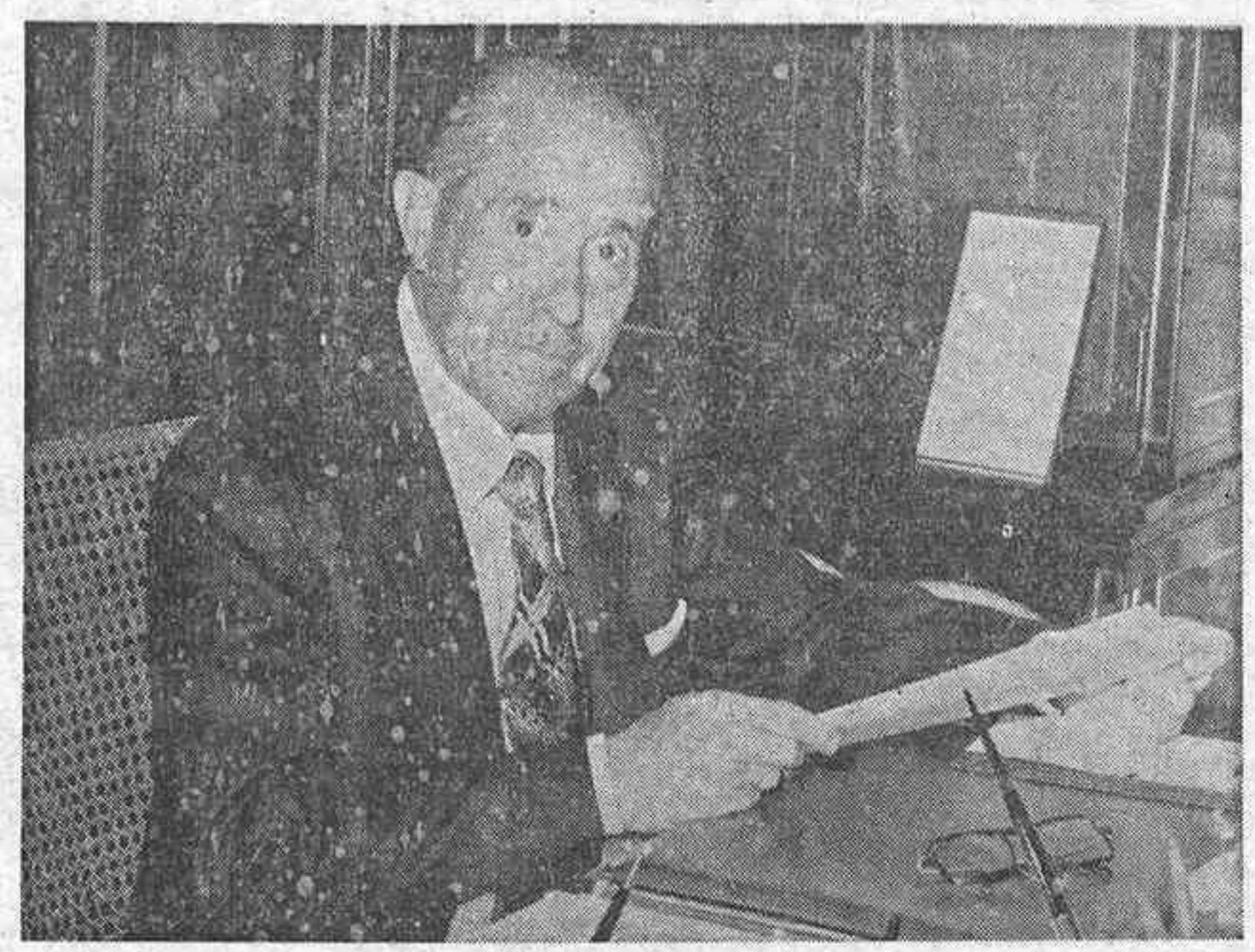
Don Carlos Arias Navarro, presidente del Gobierno, que ha formado el nuevo Gabinete, primero del Rey Don Juan Carlos. En la fotografía, el señor Arias, en su despacho.