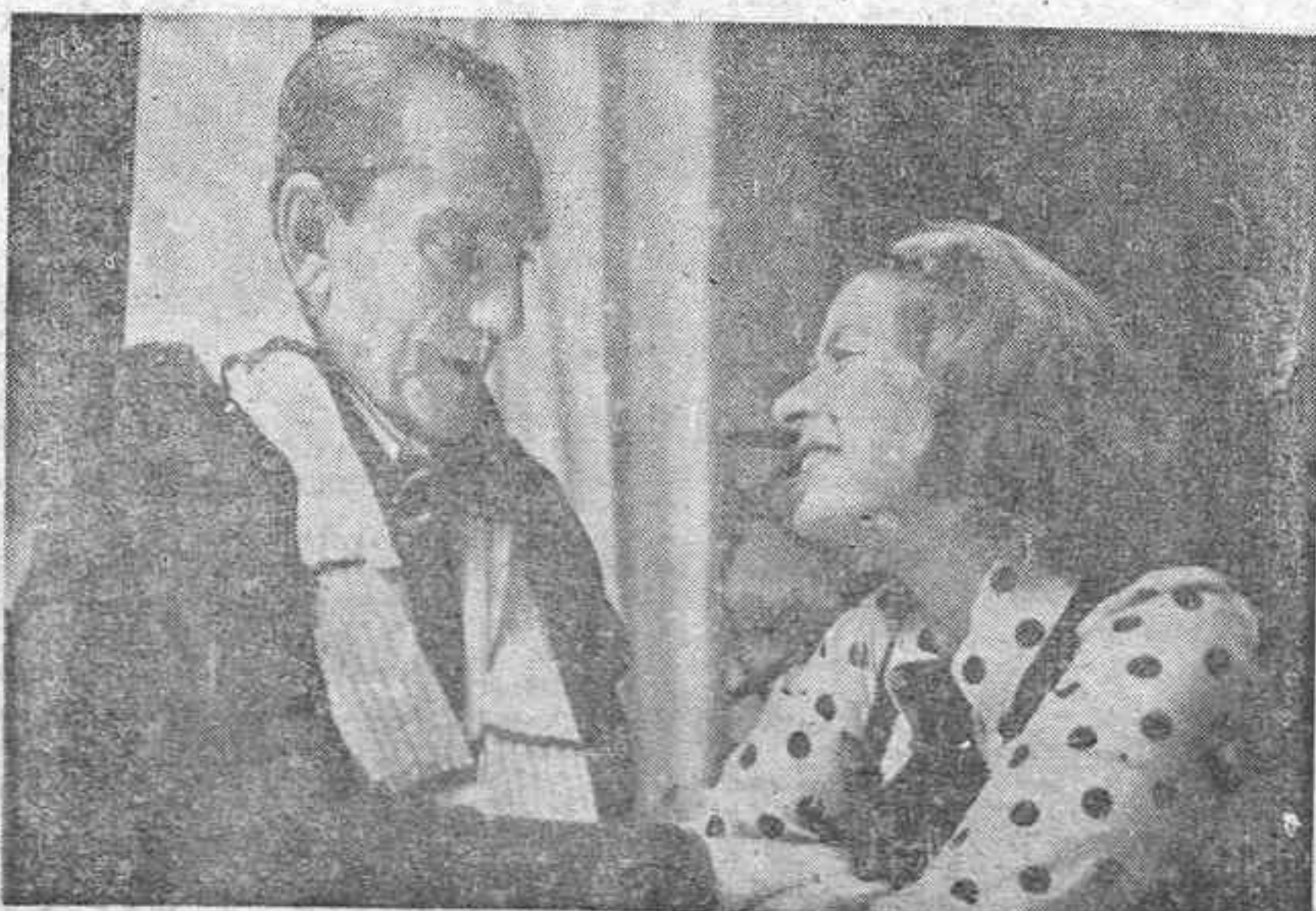
ROMA. — El director italiano de cine Luchino Visconti conversa con la actriz sueca Ingrid Bergman en el estudio donde se rueda la película «El inocente», a donde acudió en su silla de inválida para presenciar el rodaje. La película está basada en la historia y vida del poeta italiano Gabriele d'Annunzio. La Bergman no toma parte en el filme, pero estuvo presente en la filmación. Visconti se recupera de una reciente parálisis en una pierna.