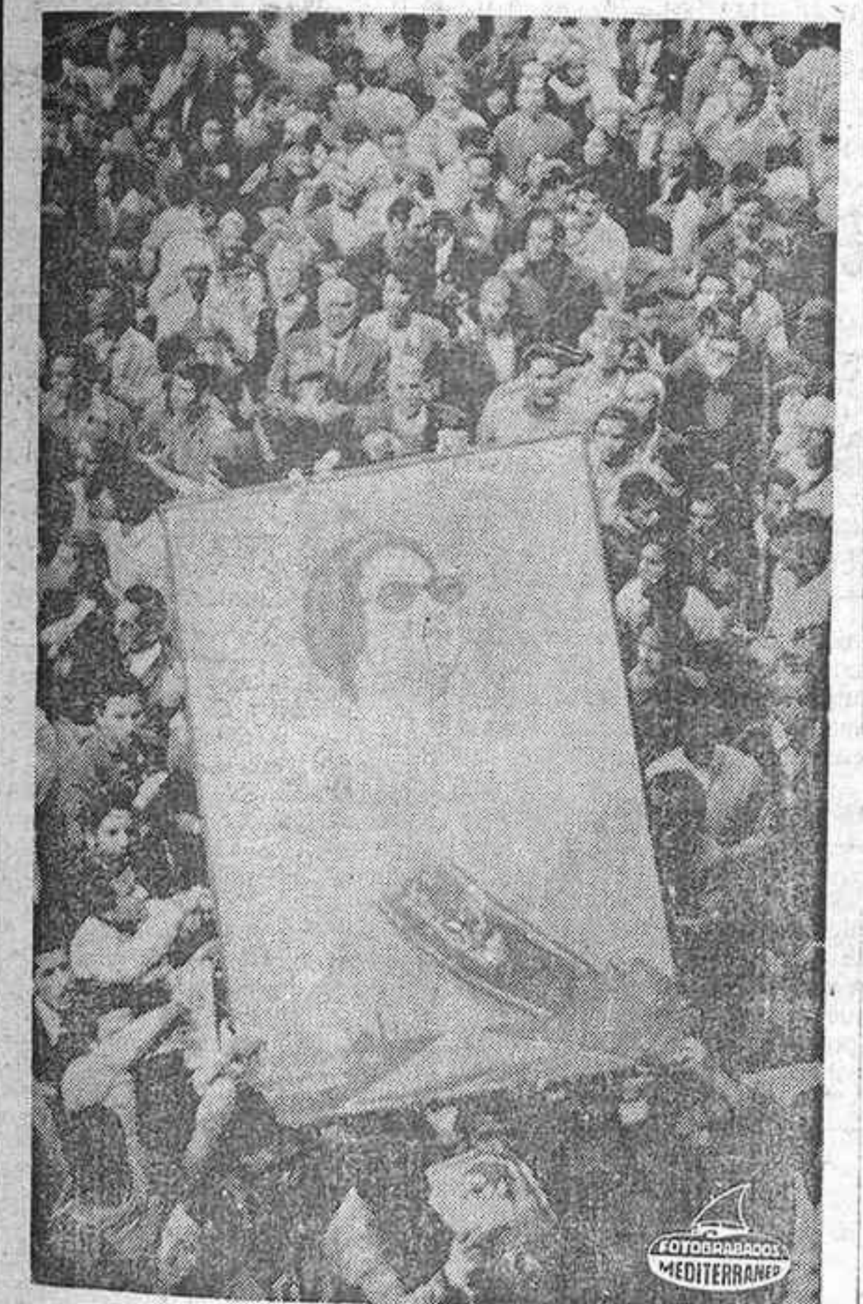
EL CAIRO. — Miles de egipcios portando retratos de la cantante Om Kalthoum, han asistido al entierro de su ídolo, fallecida el pasado lunes a causa de un ataque cardíaco. La fotografía recoge un momento de dicha ceremonia.