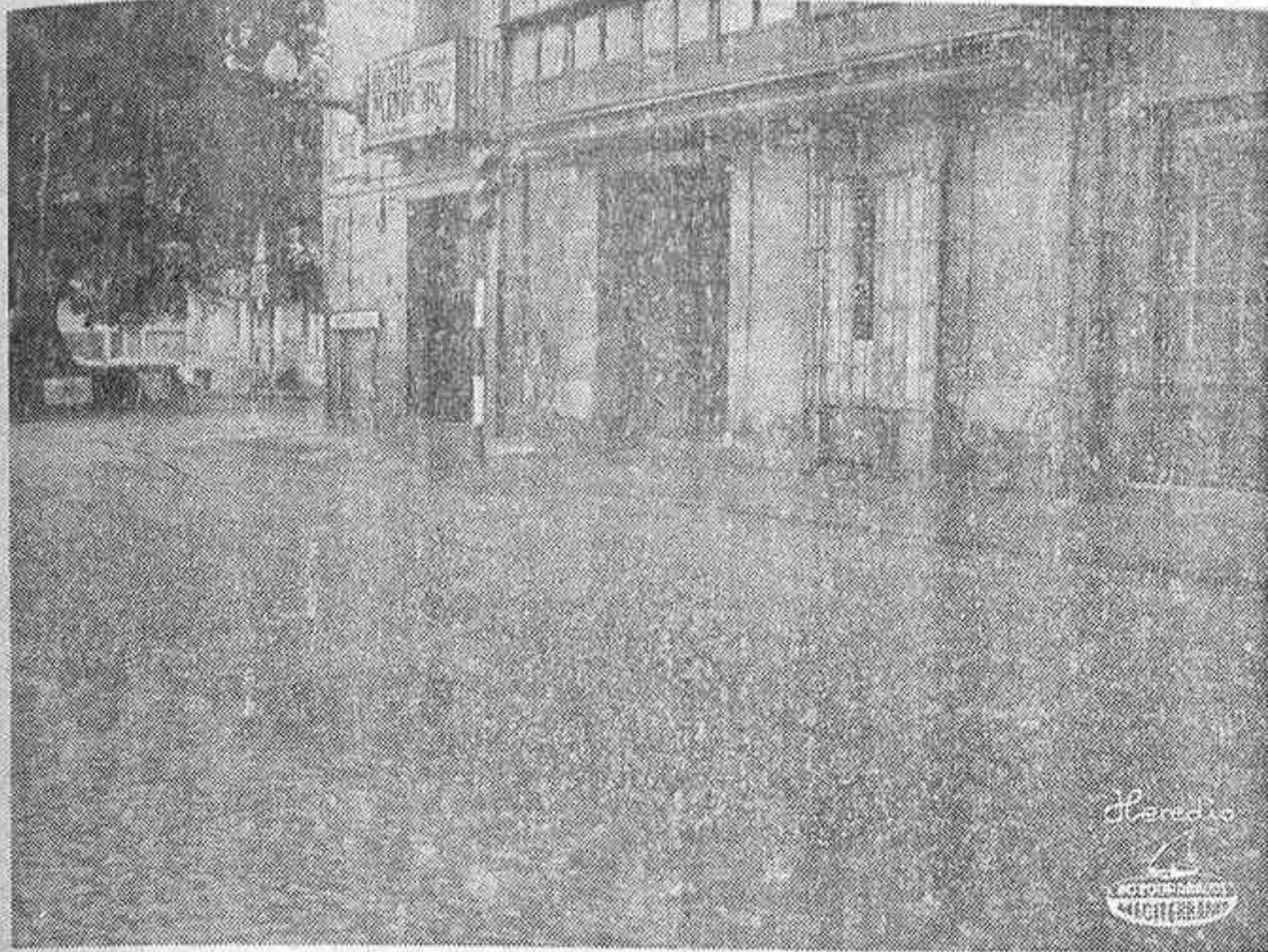
Aspecto que ofrecía el final de la calle Mayor durante la granizada que cayó sobre la ciudad ayer en torno al mediodía

ESPECTACULAR GRANIZADA EN LA ZONA BAJA DE LA HUERTA