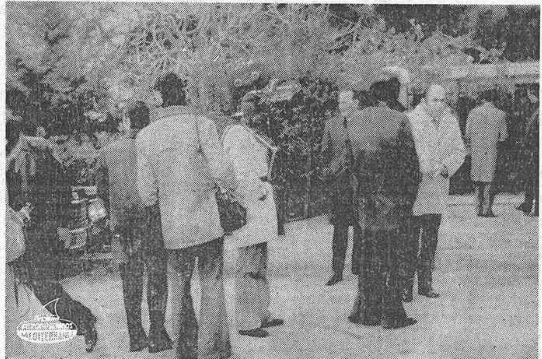
ATENAS. — Periodistas, fotógrafos, cámaras y amigos de Onassis aparecen frente a la residencia del millonario naviero en G'lyfada, donde se encuentra el famoso hombre de negocios en grave estado, según se ha informado.

MADRID, 6. (Pyresa).— Bajo la presidencia de D. Carlos Arias Navarro se han reunido esta mañana, en la sede de Presidencia del Gobierno, todos los titulares de los departamentos ministeriales, en sesión preparatoria del Consejo de Ministros, que se celebrará mañana en el palacio de El Pardo y que tendrá carácter decisivo.