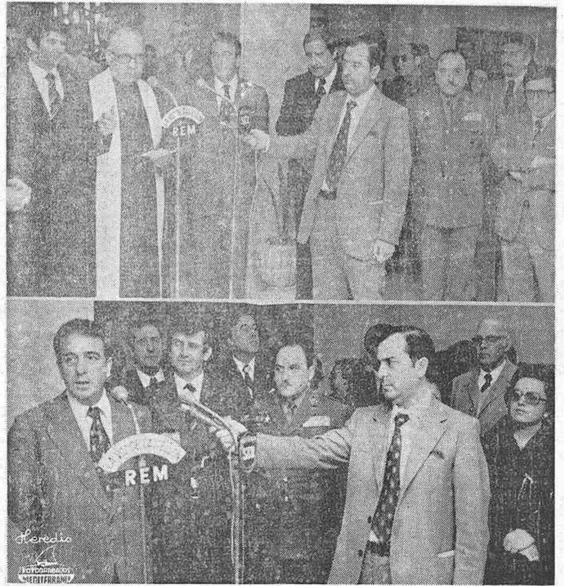
Los momentos del acto de bendición e inauguración de los nuevos locales.