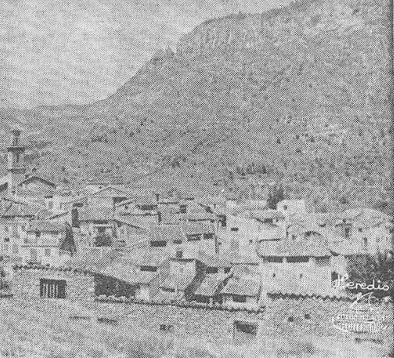
EL DIRECTOR GENERAL DE OBRAS HIDRAULICAS Y EL GOBERNADOR CIVIL ACCIDENTAL, A SU LLEGADA A PUEBLA DE ARENOSO, CON EL ALCALDE Y AUTORIDADES DE DICHA LOCALIDAD Y UN MOMENTO DE LA ENTRADA EN CAMPOS DE ARENOSO. VISTA GENERAL DE ESTA POBLACION, SOBRE LA QUE EN SU DIA CAERAN LAS AGUAS DEL GRAN EMBALSE DEL PROYECTADO PANTANO DE MONTANEJOS