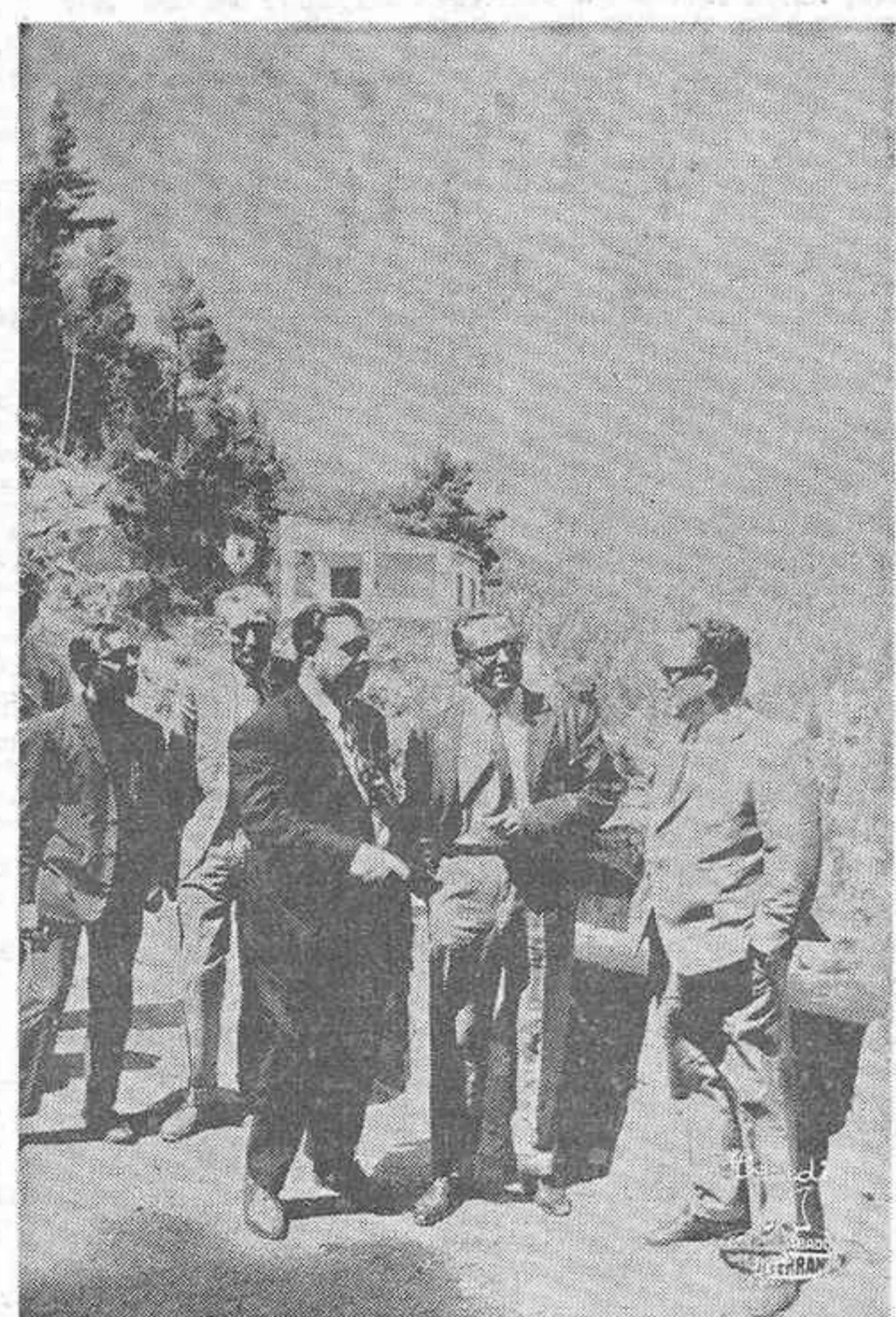
—concluyó— es el problema que debemos abordar, con la ayuda de las autoridades que hoy nos visitan".

Finalmente el Alcalde hizo una detallada exposición de las zonas que resultarán afectadas por el embalse, informando que serán 66 las familias damnificadas. "Este