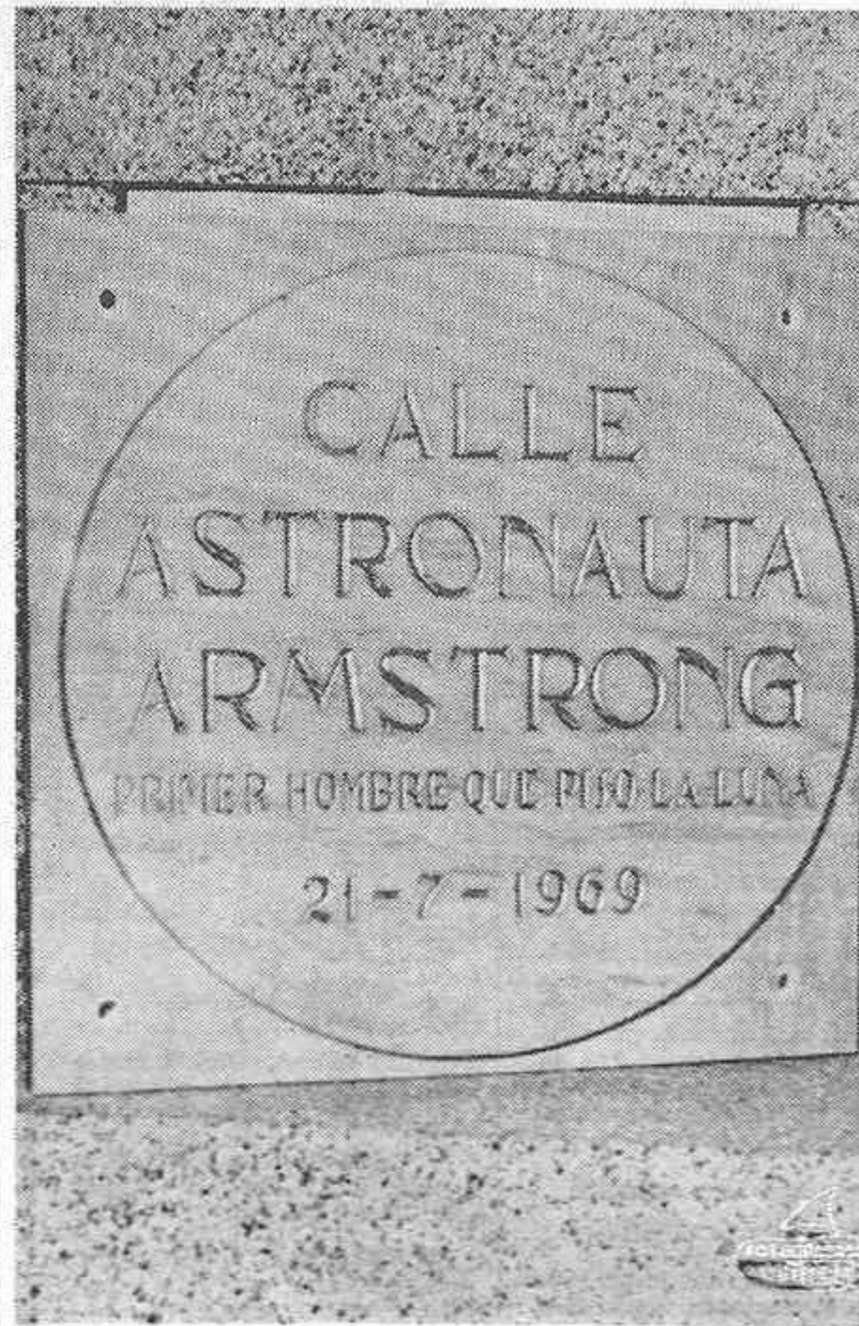
MATARO. - Esta es una de las placas que la ciudad de Mataró dedicará en una calle de la localidad al astronauta americano NEIL ARMSTRONG, primer hombre que pisó la Luna.