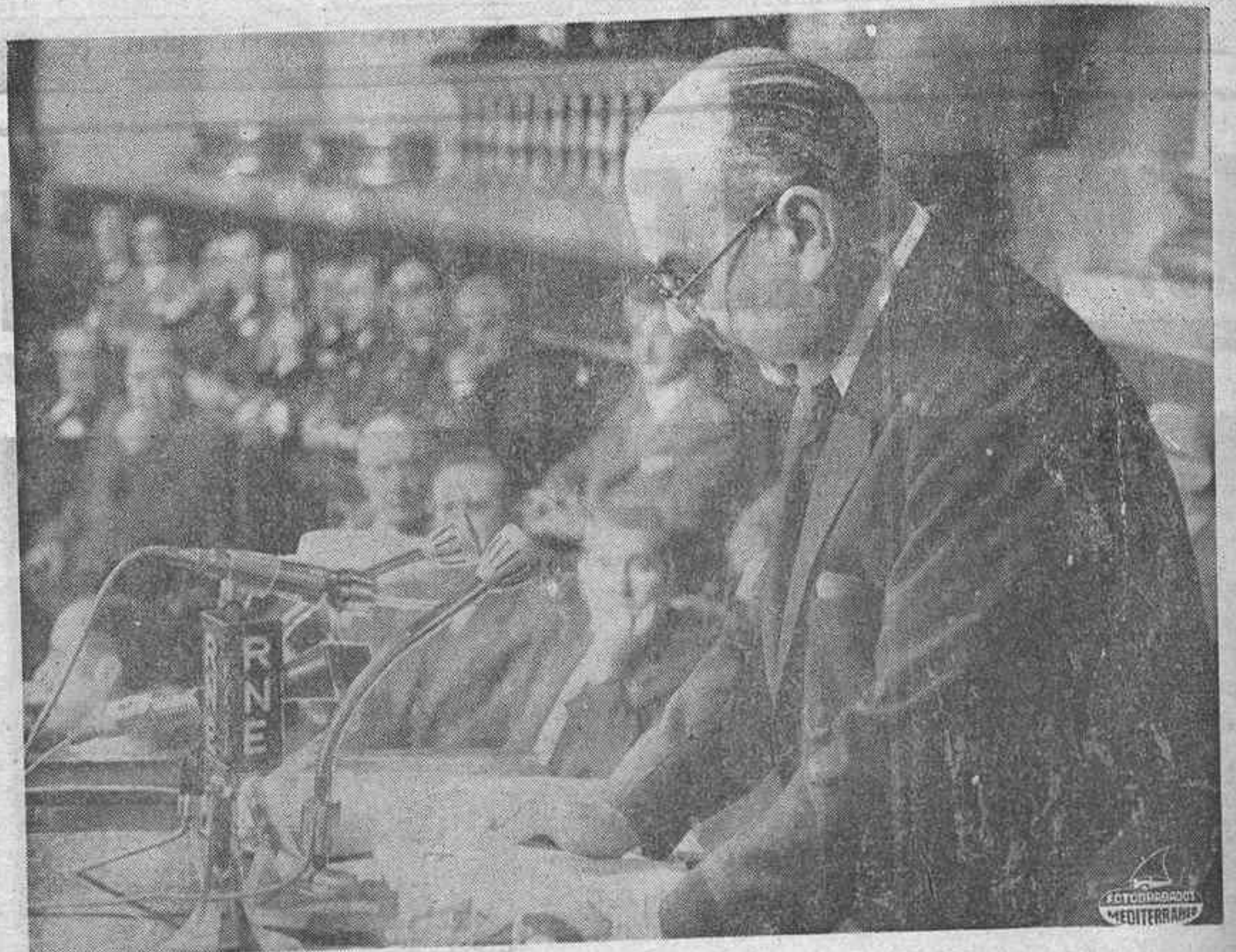
El Almirante Carrero Blanco en una de sus últimas intervenciones ante el pleno del Consejo Nacional.

MADRID, 20 (Servicio de Documentación de PY-RESA). — Don Luis Carrero Blanco nació en Santoña (Santander) el 4 de marzo de 1903 y a los quince años ingresaba en la Escuela Naval con el número uno de su promoción. Perteneciente a una familia de militares, su biografía es una sucesión de hechos directamente relacionados con la milicia.