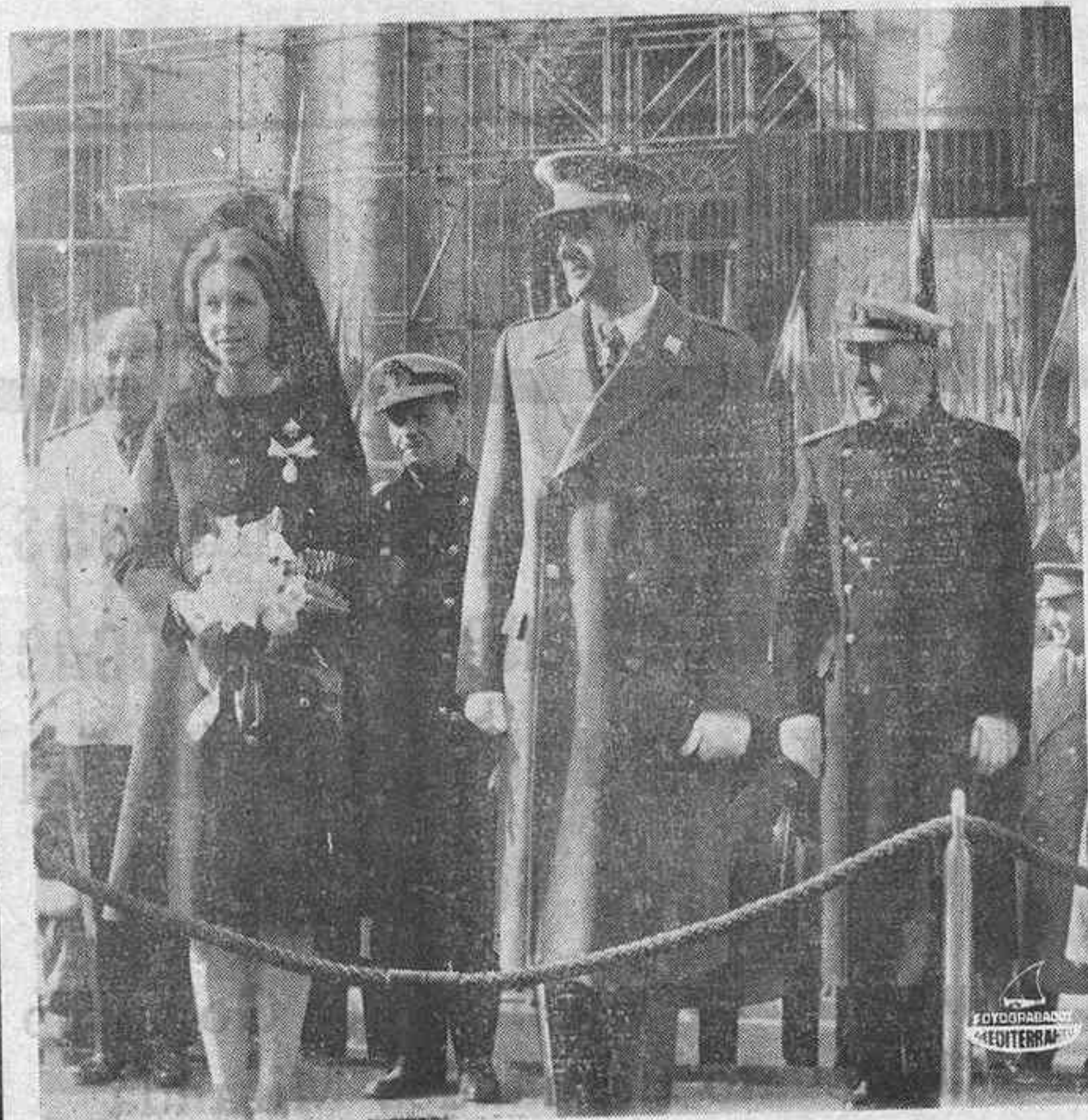
El pasado día de la Patrona de la Infantería fue tomada esta foto del Almirante Carrero Blanco, con los Príncipes de España, durante el desfile de las fuerzas.