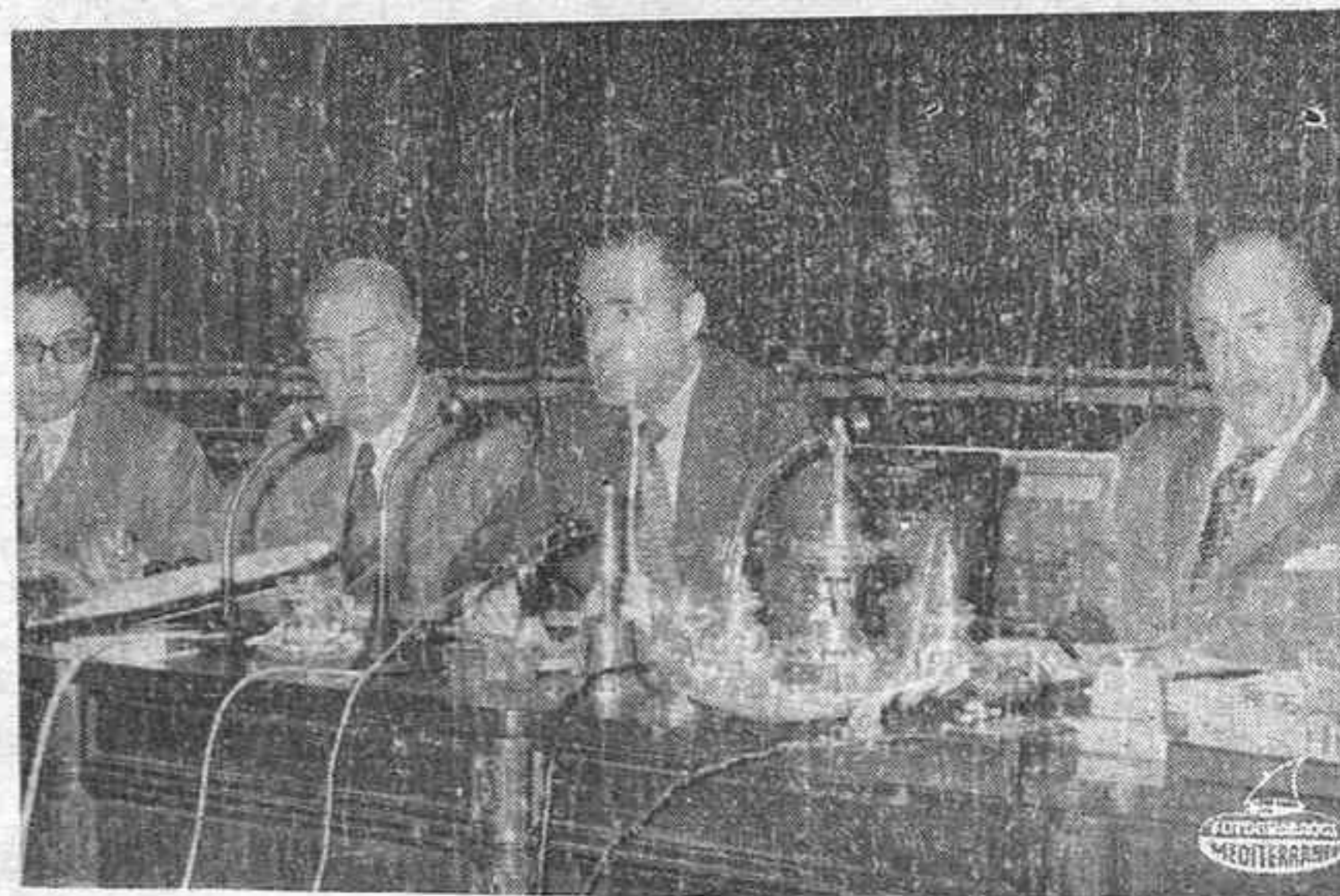
MADRID. — El ministro de Industria, Sr. López de Letona, durante el informe relativo a su Departamento presentado el lunes ante las Cortes Españolas.