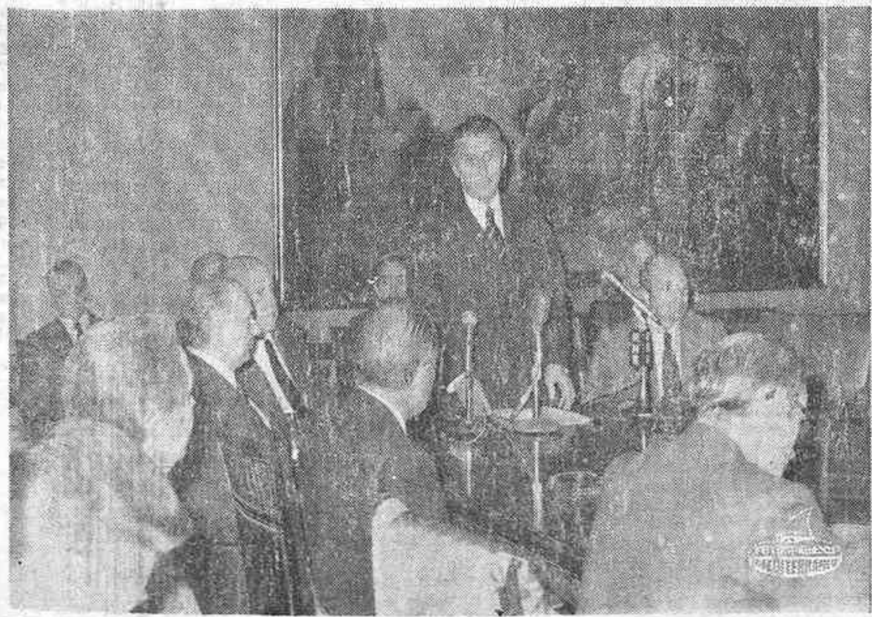
MADRID. — Un momento de la rueda de prensa celebrada esta mañana por el Ministro de Industria, Sr. Barrera de Irmo, en la sede de su Departamento, en el curso de la cual conversó con los representantes de los medios informativos acerca de la actual situación económica.