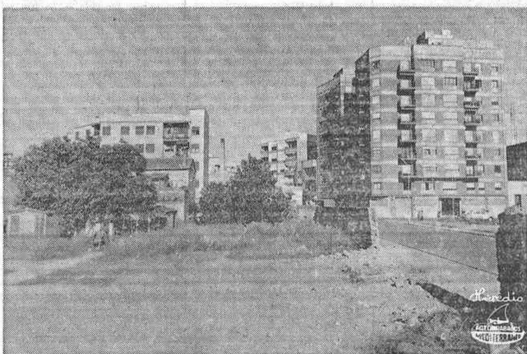
AQUI HAN DESARROLLADO SU ACTIVIDAD LOS ULTIMOS «FILAORS» CASTELLONENSES