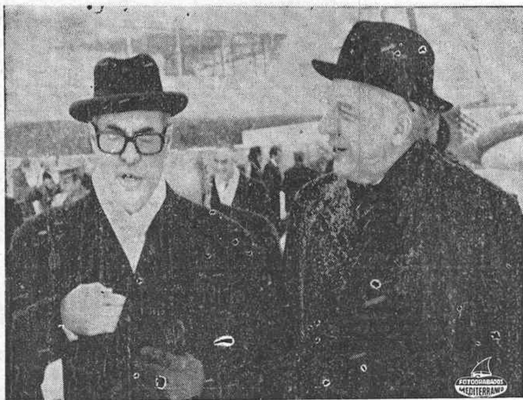
BONN. — El Ministro alemán de Asuntos Exteriores, Walter Schell (derecha), acompaña a su colega español, Laureano López Rodó, en el aeropuerto de Colonia-Bonn, a donde acudió a recibirle. El Ministro español se ha trasladado a Alemania Occidental en viaje de visita de dos días de duración.

Firma de un nuevo convenio de seguridad social hispano-alemán