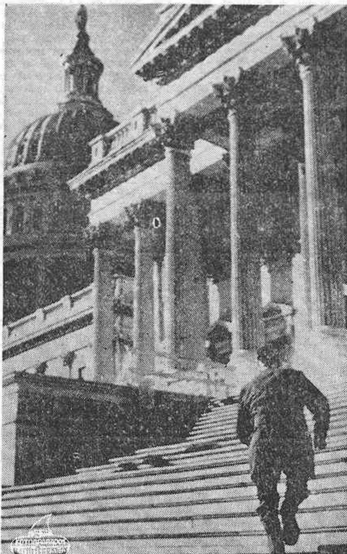
WASHINGTON. — Desde hacia más de un siglo, exactamente desde 1861, el Senado norteamericano no se reúne en domingo. Hoy ha sido la primera vez y el senador James Allen se le olvidó por la fuerza de la costumbre...