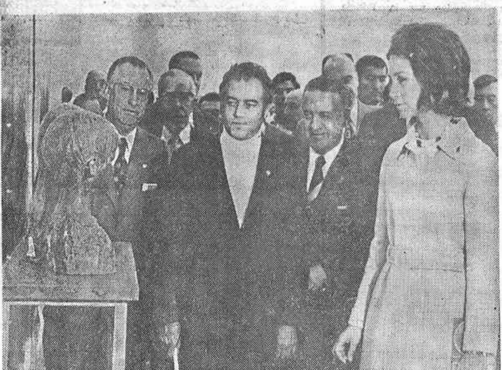
MADRID. — La Princesa de España, durante su visita al XLIII Salón de Otoño, en el Palacio de Cristal de El Retiro. En la foto contempla dos cabezas esculpidas por el escultor Santiago de Santiago.