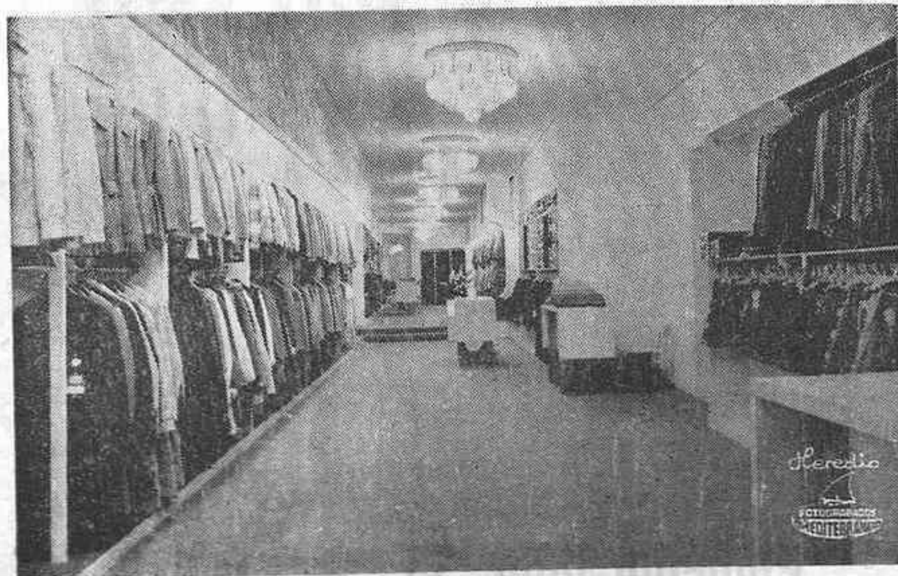
Vista de la 1.ª planta Boutique de Señora, Pollita y Niña

FELICITA A GALERIAS REVERTER POR SU 50 ANIVERSARIO, Y LA INAUGURACION DE SU NUEVA PLANTA