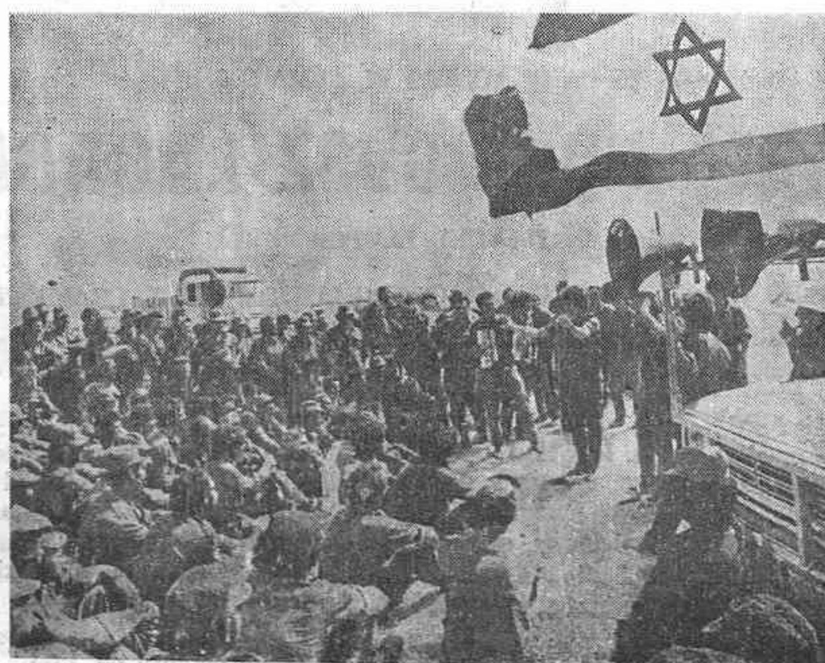
EN ALGUN LUGAR DEL SINAI. — Tropas israelitas descansan mientras contemplan a una de las actrices que han acudido a entretener sus ojos en el frente.