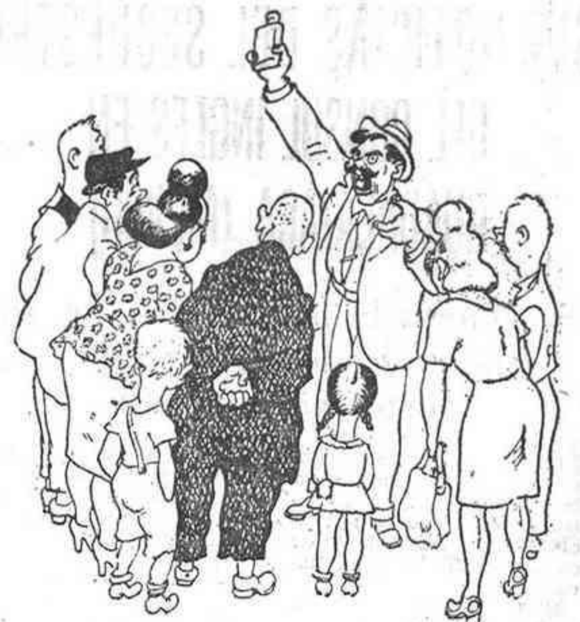
—...Y yo, sumándome a la ofensiva contra los precios, les digo: Antes, tres pesetas; ahora... ¡dos noventa y cinco!