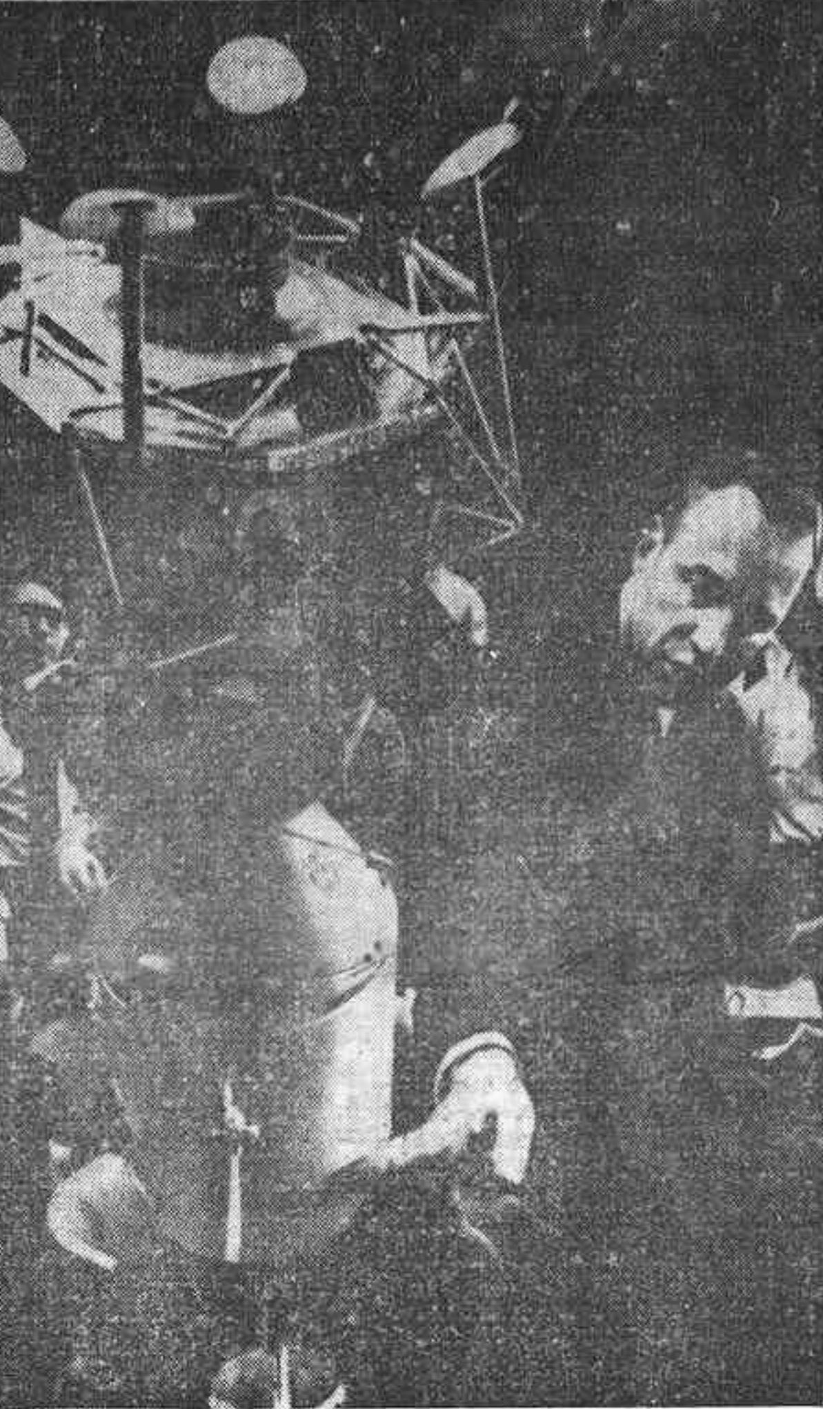
CENTRO ESPACIAL. — El comandante del «Apolo 13», James Lovell, señala el modelo del módulo de servicio en el que tuvo lugar la explosión durante su viaje a la Luna. Lovell y sus compañeros Haise y Swigert mantuvieron una conferencia de prensa en la que contestaron numerosas preguntas sobre su accidentada jornada a través del espacio

HOUSTON (Texas), 22. — (Efe). — Hubo varios momentos durante su accidentado viaje espacial en que los tripulantes del Apolo XIII temieron morir, dijeron ayer en conferencia de prensa televisada a toda la nación, James Lovell, Fred Haise y John Swigert.