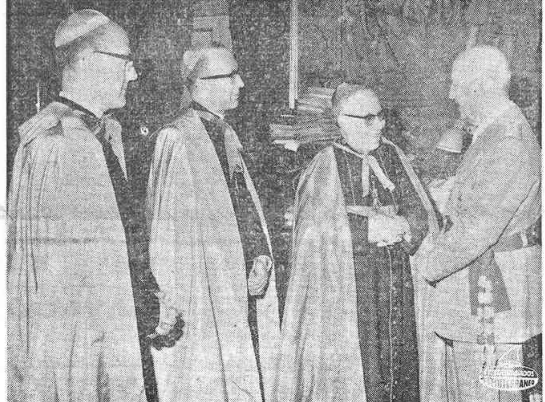
MADRID. — Se celebró en el Palacio de El Pardo el acto de presentación ante el Jefe del Estado de los nuevos Obispos de Palencia, Guadix y Almería.