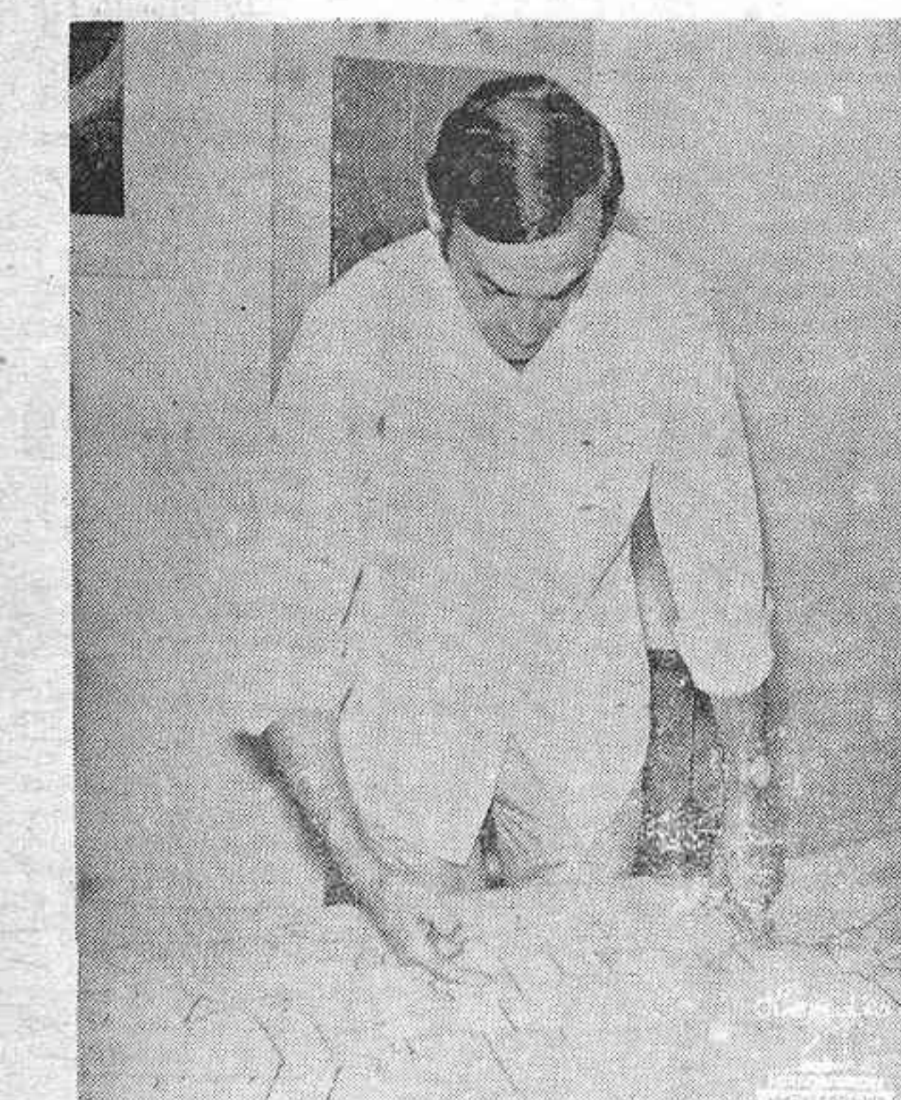
EL ARQUITECTO ANTE EL PROYECTO

Edad de 15 a 18 años. Conocimientos de Mecanografía y Contabilidad. Presentarse en Arrufat Alonso núm. 10 de 7 a 8 de la tarde.