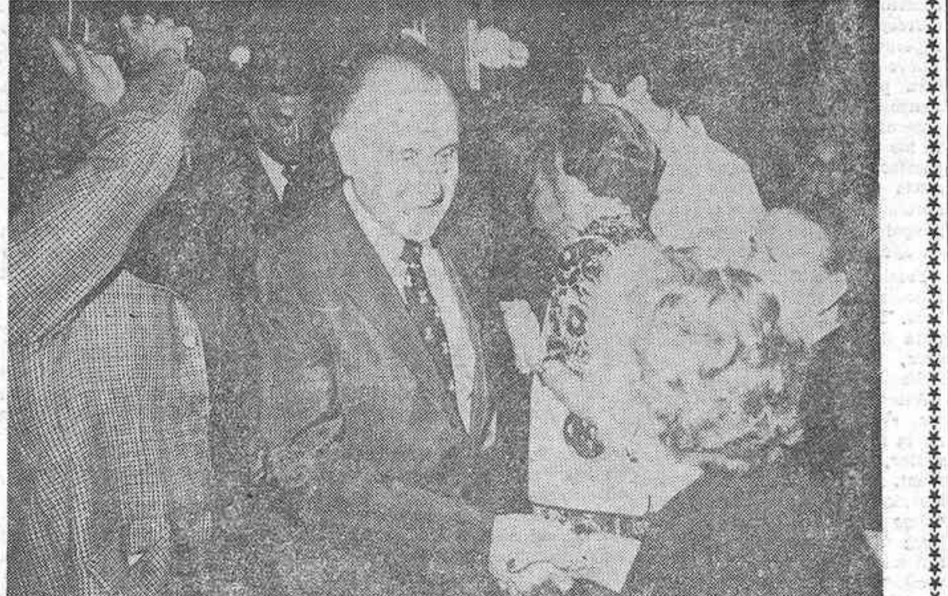
MADRID.— El ministro de Trabajo, don Licinio de la Fuente, ha presidido la inauguración de un hogar y una residencia de pensionistas, dos nuevos centros corresponsales al Plan Gerontológico Nacional y el Servicio de Asistencia Social de Ancianos. En la foto, llegada del ministro de Trabajo al nuevo centro.

LLEGAN A SANTIAGO SANTIAGO DE COMPOSTELA, 27. (Pyresa). — El Jefe del Estado Generalísimo Franco, acompañado de su esposa, llegó al aeropuerto de Navacollá, de Santiago de Compostela, en un avión de Iberia, a las doce y media de la mañana de hoy, acompañado también de los ministros del Aire y del Ejército. En el aeropuerto fue recibido por las primeras autoridades de la región gallega, Gobernador Civil y Jefe Provincial del Movimiento de La Coruña, Capitán General de la VIII Región Militar, Capitán General de la Zona Marítima del Cantábrico, Presidente de la Diputación, Alcalde de Santiago, Vice-rector de la Universidad y representaciones oficiales. La señora del jefe del aeropuerto entregó un ramo de flores a la esposa del Caudillo. Al descender del avión, el Caudillo escuchó el Himno Nacional interpretado por la banda de música de Santiago. El numeroso público le aclamó y el Jefe del Estado y señora, después de recibir la salutación de las autoridades, entre las que también se encontraba el Obispo Vicario Capitular de Santiago, en-