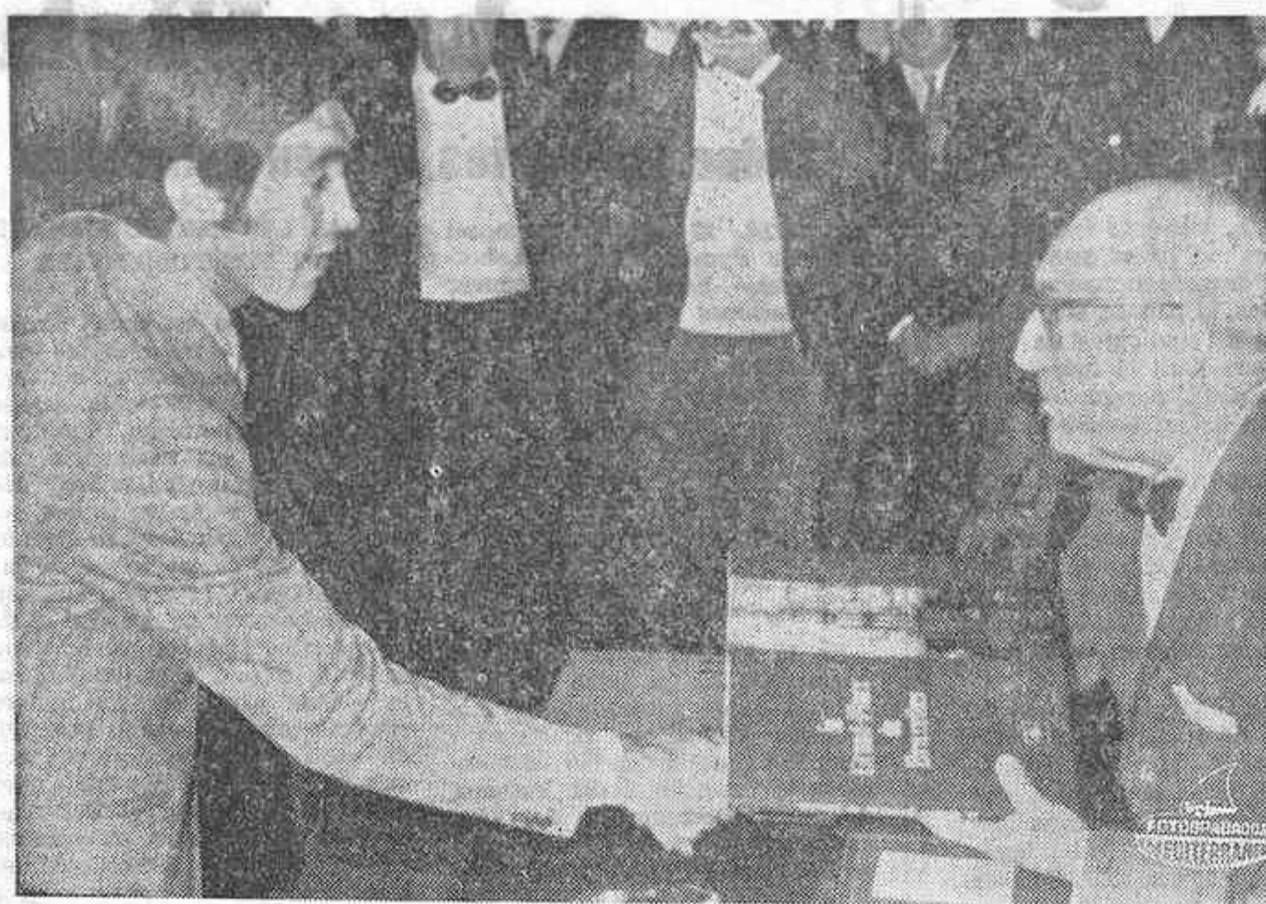
BRUSELAS. — El burgomaestre Lucien Goormans presenta al ciclista Eddy Merckx un libro titulado «La gran plaza de Bruselas» en el Town Hall de Bruselas...