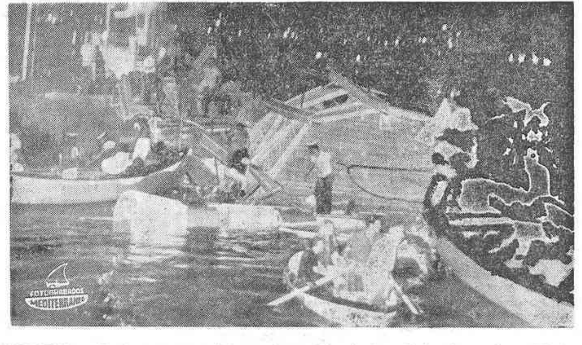
CARTAGENA. — Estado en que quedó la carroza poco después de producirse la tragedia.

Funeral en Cartagena por las víctimas del siniestro marítimo CARTAGENA, 27. (Pyresa). — En memoria de las víctimas del siniestro marítimo registrado en este puerto el pasado día 25, se ha celebrado un solemne funeral en la Iglesia Arciprestal de Santa María de Gracia. Oficiaron los Obispos titular y auxiliar de la Diócesis de Cartagena, en misa concelebrada con el Arcipreste y párrocos de toda la Diócesis. Asistieron el Gobernador Civil y Jefe Provincial del Movimiento que ostentaba la representación del Ministerio de la Gobernación; Capitán General de la Zona Marítima del Mediterráneo, Alcalde de la ciudad, Presidente de la Diputación, Gobernador Militar y todas las autoridades provinciales y locales, civiles y militares, así como la corporación municipal y los consejos provinciales y local del Movimiento en pleno. En lugares preferentes se situaron las familias de las personas fallecidas en el trágico accidente. El templo se encontraba totalmente abarrotado de fieles, así como la calle y zonas adyacentes. Se han recibido testimonios de condolencia de toda España, destacando entre ellos el del Príncipe de España D. Juan Carlos de Borbón, de los Ministros de Trabajo y Marina, así como los de numerosos gobernadores presidentes de Diputación, alcaldes de toda España y entidades y organismos.