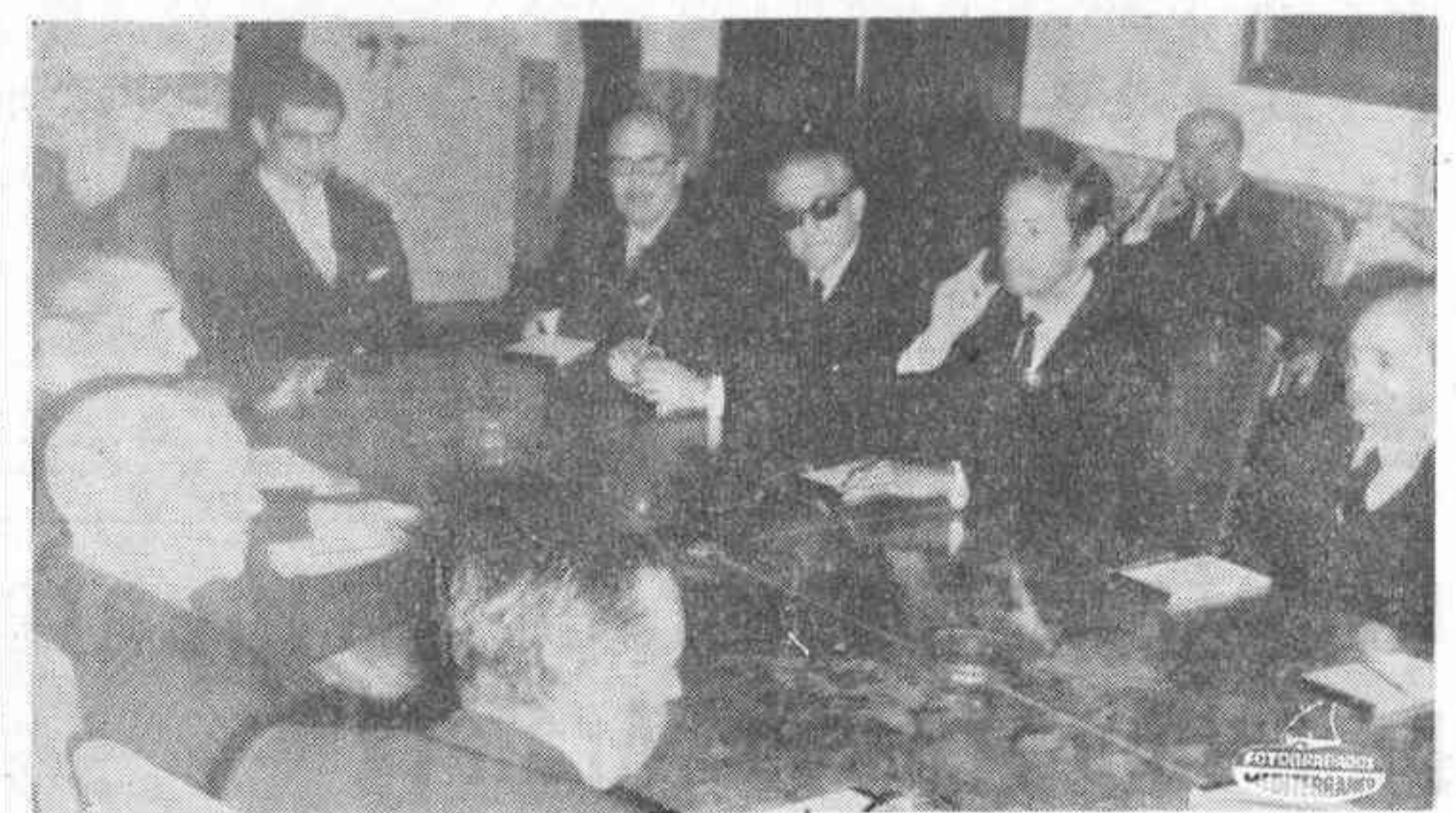
LISBOA. — Comenzaron esta mañana las conversaciones hispano-portuguesas que presiden los ministros de Asuntos Exteriores de España y Portugal, Sres. López Bravo y Rui Patrício. En la fotografía, un momento de la sesión de trabajo en el ministerio.