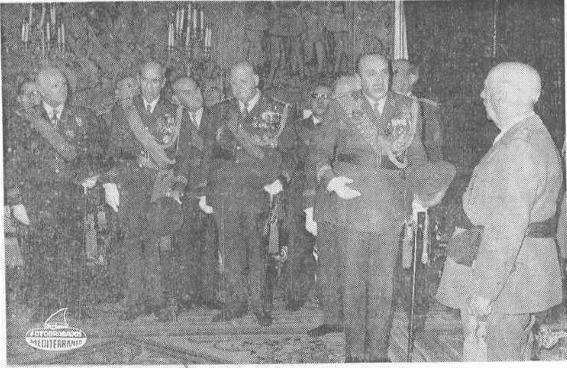
MADRID. — S.E. el Jefe del Estado durante la audiencia concedida a una comisión de generales del Arma de Infantería y Cuerpos que, presidida por el Ministro del Ejército, le han cumplimentado y reiterado su leal adhesión con motivo de la celebración de la festividad de la Patrona de dicha Arma, la Inmaculada Concepción.