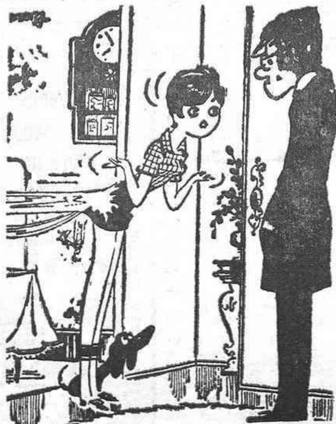
—Vas a ver, querido. Te he preparado un plato con queso «gruyere» que te vas a chupar los dedos.