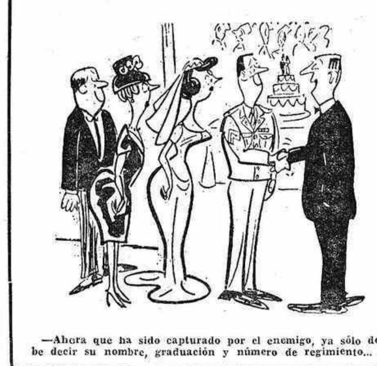
—Ahora que ha sido capturado por el enemigo, ya sólo debe decir su nombre, graduación y número de regimiento...