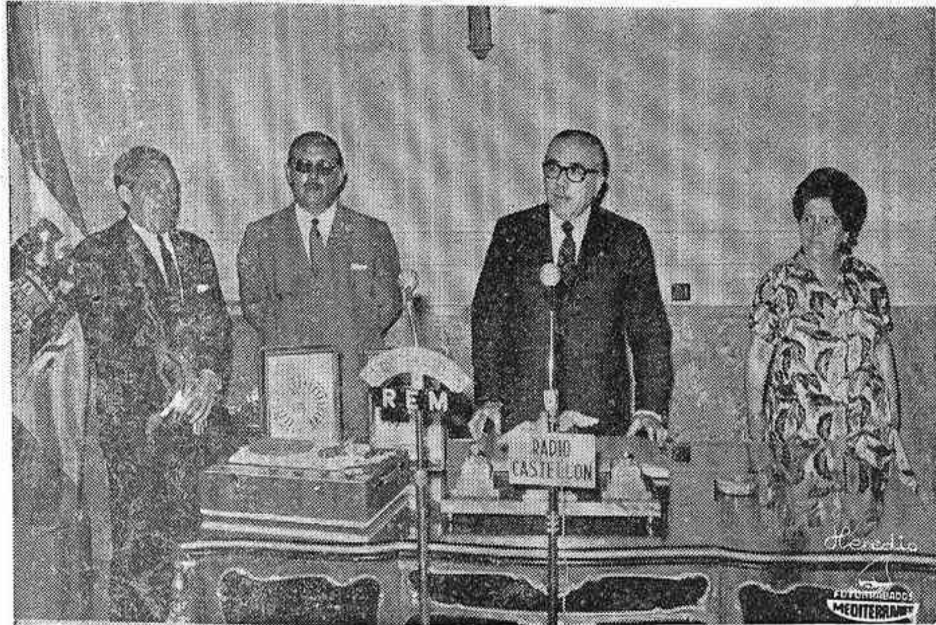
El Gobernador Civil y Jefe Provincial del Movimiento durante las palabras que pronunció en el acto

Seguidamente el Secretario General del Gobierno Civil fue llamando a los Alcaldes y enumerando el tipo de obra que se subvencionaba y la cantidad que importaba dicha subvención. Así se acercaron a la mesa y recibieron las correspondientes subvenciones los representantes de los pueblos que se citan así como los conceptos y circunstancias por lo