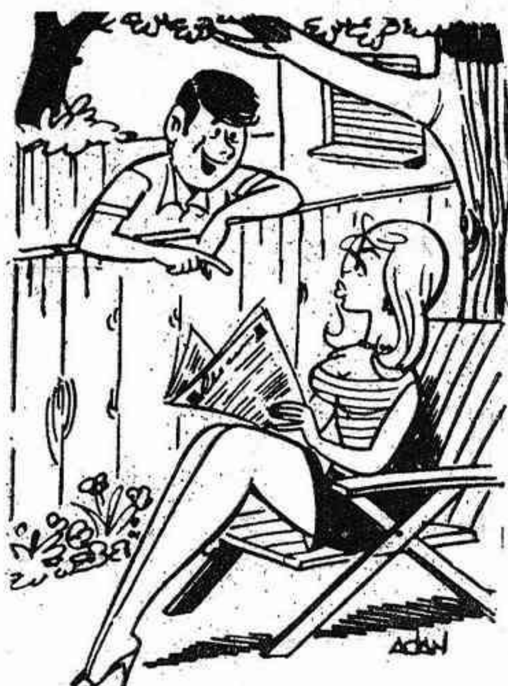
—¿Podría dejarme la página de la cartera?. Descartaría involuntariamente al cine.