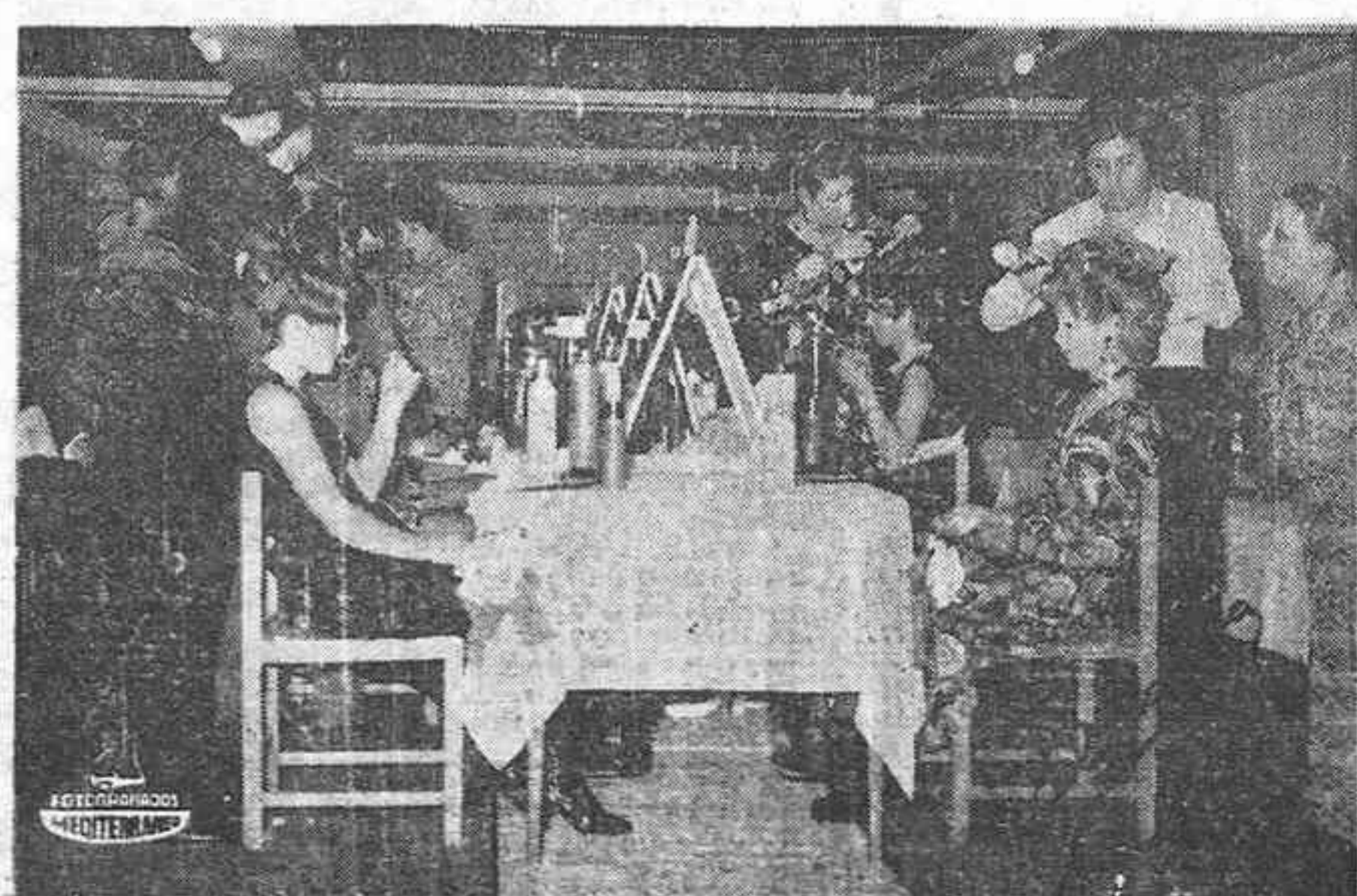
Los participantes dando su último toque a una de sus oraciones

Gobierno, Coordinación y Relaciones Públicas; Economía General y de la Empresa; Comercio, Aduanas y Transportes; Régimen Fiscal; Crédito y Financiación; Asuntos Sociales y Estaciones Locales; Asuntos Provinciales.