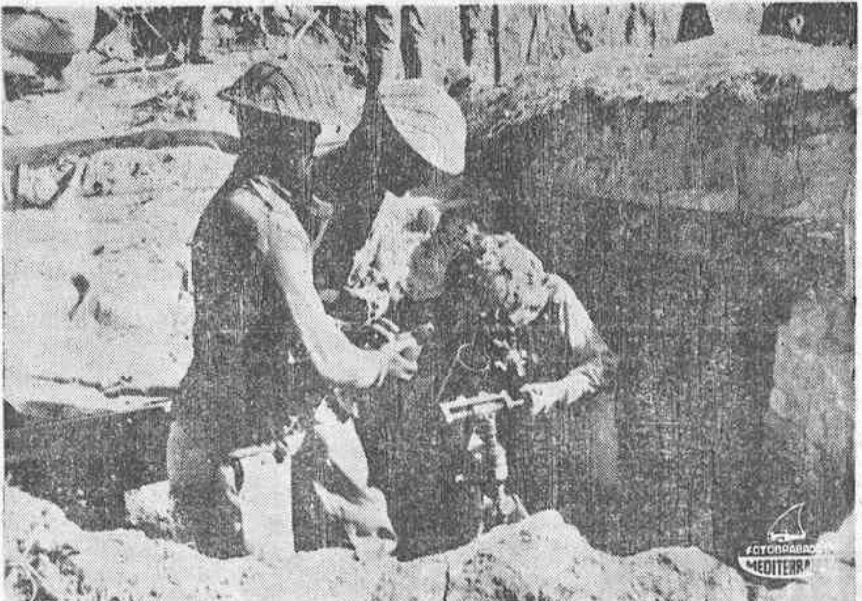
PAKISTAN ORIENTAL. — Soldados pakistaníes emplazan un mortero a 2.000 millas de la villa de Dargapara, para hostigar a la artillería india.

El Presidente Yayha Khan pide la presencia de observadores de las Naciones Unidas