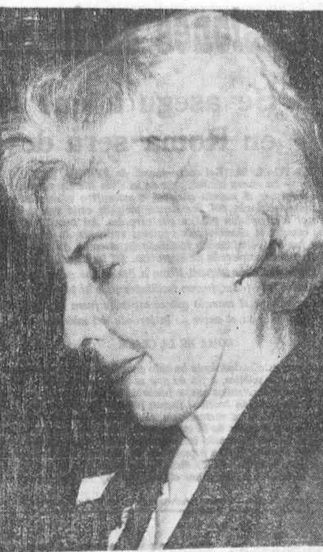
MADRID. — Foto de archivo de la famosa actriz cinematográfica Barbara Stanwyck, a quien le ha sido extirpado el riñón izquierdo. Permanecerá hospitalizada en Santa Mónica (California) durante varias semanas.