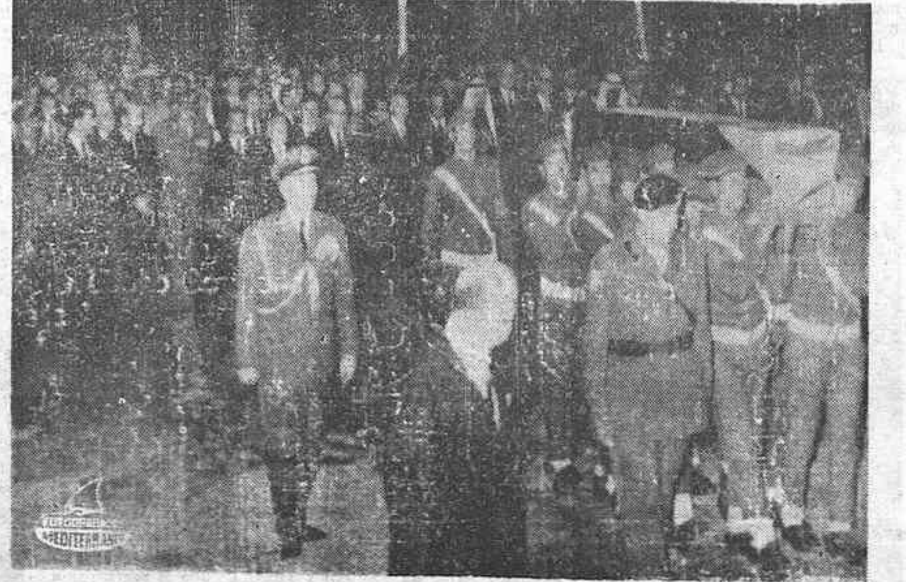
EL CAIRO. — Los restos del jefe del Gobierno Jordano, Wasfi El Tell, asesinada el domingo, fueron trasladados por vía aérea a su país en la misma fecha, en avión especial, tras rendirle honores militares en el aeropuerto de El Cairo, con asistencia de Ministros del Consejo de Defensa Árabe, el jefe de Seguridad Nacional de Egipto, Hafez Ismail y el jefe del Gobierno, Mahmud Fauzi.

MOSCU, 30 (Efe-Upi).— El satélite soviético, no tripulado "Marte-II" se encuentra en órbita alrededor del planeta Marte. Tras haber recorrido 470 millones de kilómetros desde su lanzamiento el 19 de mayo, la estación "Marte" fue frenada a las 23'19 horas del día 17 de noviembre, entrando en órbita del satélite en torno a Marte. Según las mediciones realizadas el pasado día 28, los parámetros de esta órbita son fuertemente elípticos, con 25.000 kilómetros de distancia máxima de la superficie del planeta y sólo 1.380 kilómetros de distancia mínima. La inclinación respecto al Ecuador de Marte es de 48 grados 54 minutos y el recorrido orbital de 18 horas. Con esta información oficial sobre el destino de la estación soviética "Marte-II" han concluido las especulaciones sobre un posible intento espectacular de toma de tierra en el planeta Marte, y se demuestra que la estación interplanetaria soviética sigue también el camino de estaciones semejantes norteamericanas —sondas— que pretenden estudiar las condiciones del planeta legendario desde sus órbitas respectivas antes de arriesgar un contacto directo. Entretanto, la estación "Marte-III", lanzada poco después, ha recorrido una órbita interplanetaria de 472 millones de kilómetros y se encuentra a una distancia lineal de 183,3 millones de kilómetros de la Tierra, según datos del 29 de noviembre hacia las 21 horas de Moscú. La información oficial promete nuevos datos sobre el trabajo de las dos estaciones "Marte".