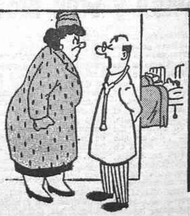
«Está delirando, pregunta por usted constantemente.»