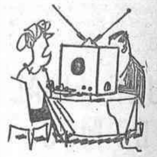
—Cuando lees el periódico eras más soportable, Camilo.