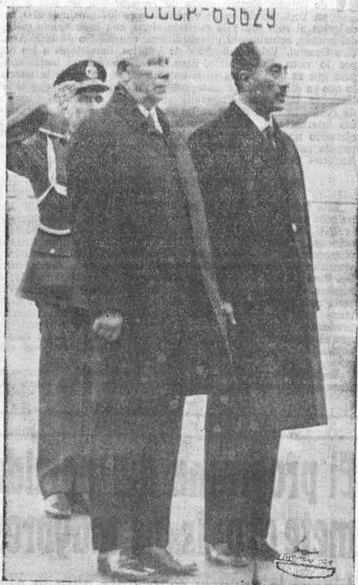
MOSCU.— El presidente Podgorny permanece junto al presidente de Egipto Anwar Sadat, durante la interpretación de los himnos nacionales de ambos países. Tras ellos se encuentra el avión especial de Aeroflot, en el que realizó Sadat el vuelo hasta Moscú.

EN UNA ATMOSFERA DE «AMISTAD, CORDIALIDAD Y PLENA COMPRESION MUTUA»