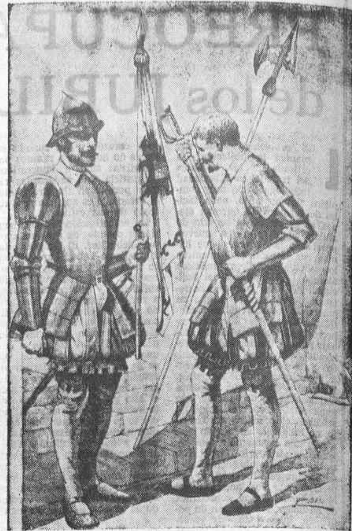
Dos soldados de los Tercios, la tripulación de combate de las galeras españolas en la Batalla de Lepanto.