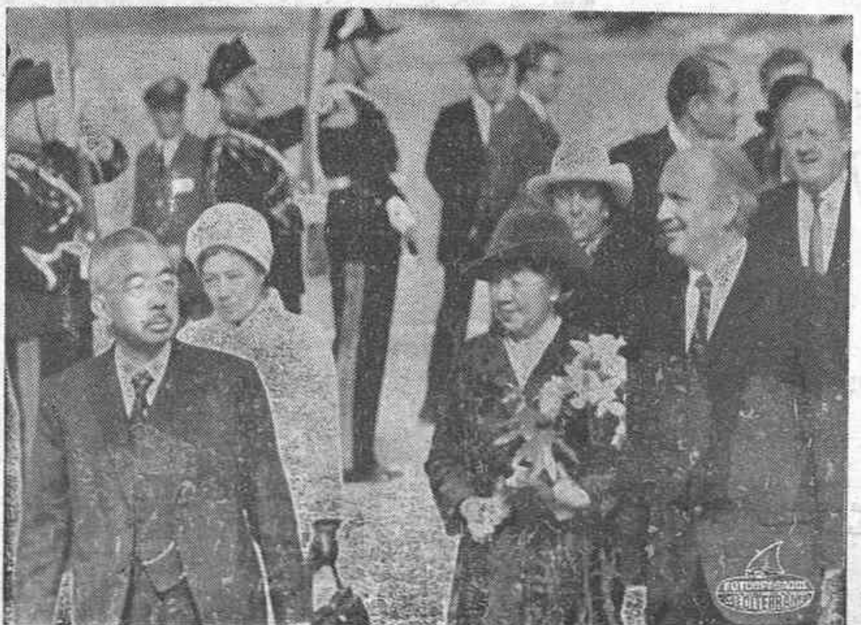
GINEBRA. — El Emperador Hiro Hito y su esposa la emperatriz Na gako a su llegada al aeropuerto de Ginebra, donde fueron recibidos por diversas personalidades suizas.

Escoja la alfombra que desee para TAPIZAR SU COCHE en 20 minutos la colocaremos Avda. Rey D. Jaime 98 (Frent. Instituto). Telf. 216452