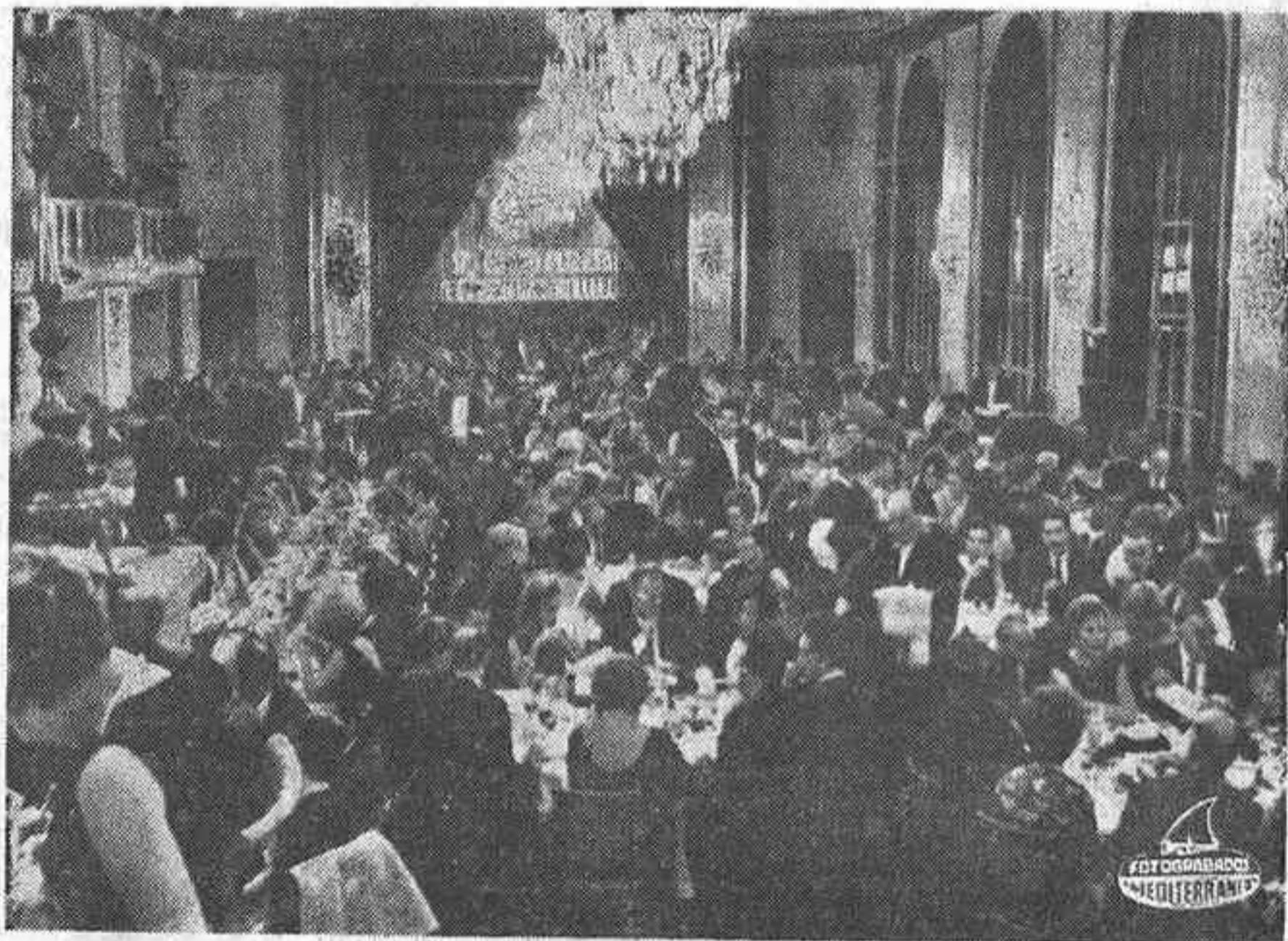
Entre plato y plato del menú, se cruzan apuestas sobre el presunto ganador del Premio Planeta, en el banquete celebrado anualmente y en el que se anuncia la marcha de las votaciones del jurado y la elección final del ganador.

Los dos premios literarios españoles mejor dotados económicamente son el Planeta y el Nadal. El primero en ser creado fue el Nadal, concedido por primera vez en la Noche de Reyes de 1943, a Carmen Laforet, por su novela «Nada». La galardonada recibió en metálico cinco mil pesetas... Hoy, el Nadal está dotado con un millón de pesetas. Cien mil pesetas más co-