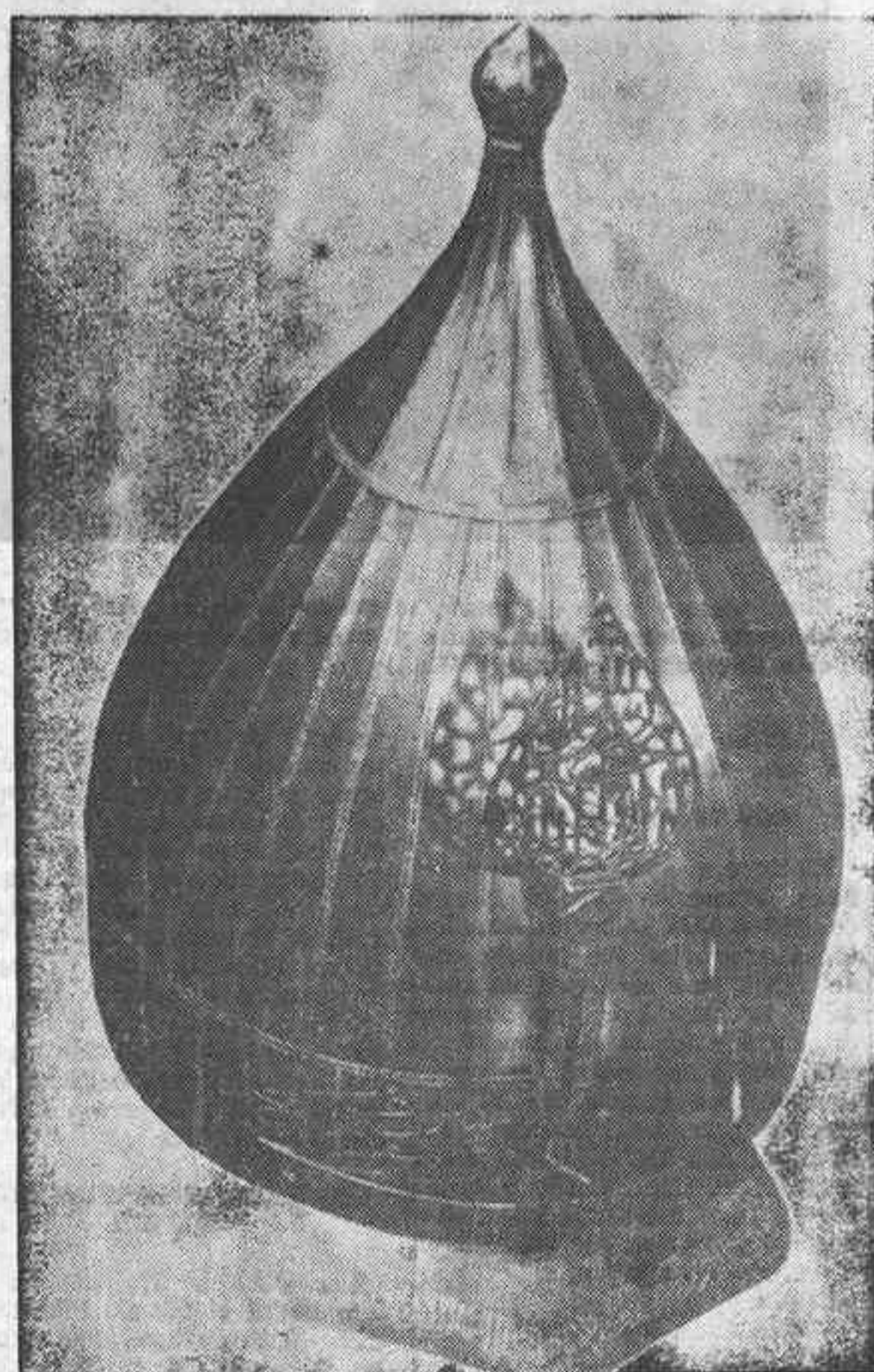
El casco del almirante turco Ali Bajá en la Batalla de Lepanto, conservado en la Armería Real de Madrid.

España: 90 galeras, 24 navas, 50 buques ligeros.