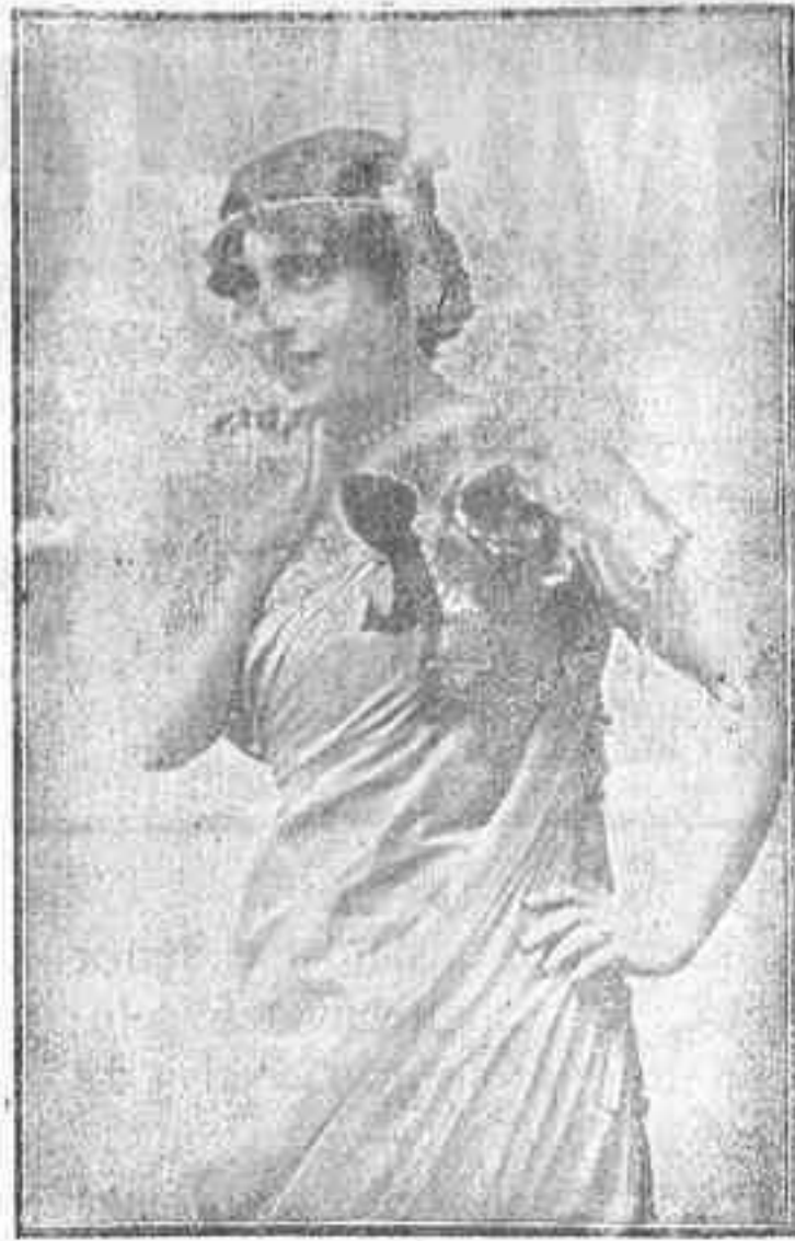
MEXICANA-NANA simpática artista que actúa en el Parque Recreativo.

Pierde la lucha todo carácter humano bajo este fuego continuo. No se tiene conciencia del peligro ni de la fatiga y se obedecen las órdenes sin comprender su alcance. Se olvida la muerte. Cuando tuve que llevar despachos por vez primera, bajo el fuego enemigo, salí a tierra al ver que estallaba una granada ante mí y aguardé, observando si venían otras. Ahora ya no me cuida más de eso. Hace dos días mi compañero, que me seguía a veinte metros de distancia, fué muerto por una granada, sin que esto causase ningún efecto en mi espíritu. Allí abajo, os lo aseguro, no somos mejores que bestias.”