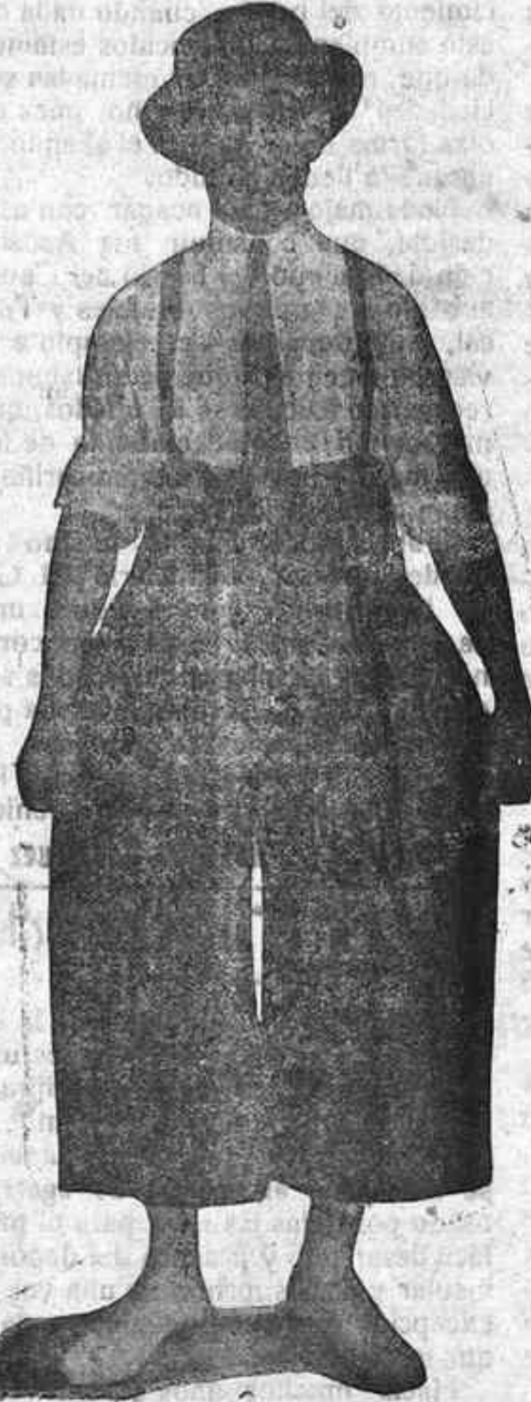
puede morir ya con tranquilidad de ángel, porque deja su retrato en manos de un magnífico y reputado "pintor".

Y Palacios que es artista de talento debido a sus muchos años de práctica por los escenarios (lo hemos llamado acaso setentón?), supo copiar la mímica de Tomasín, de ese divertido actor "mudo", que