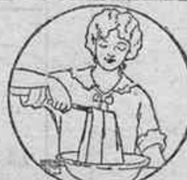
Tiñalos pronto y fácilmente con un mo de los bellísimos tintes RIT.