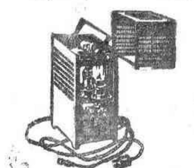
Rectificador Philips para garage Seguro — Práctico — Económico