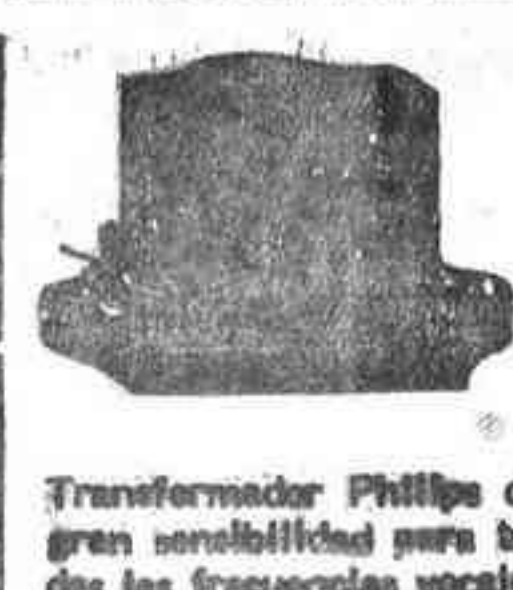
Transformador Philips de gran sensibilidad para todas las frecuencias vocales y musicales entre 50 y 10 mil períodos por segundo, tamaño reducidísimo.