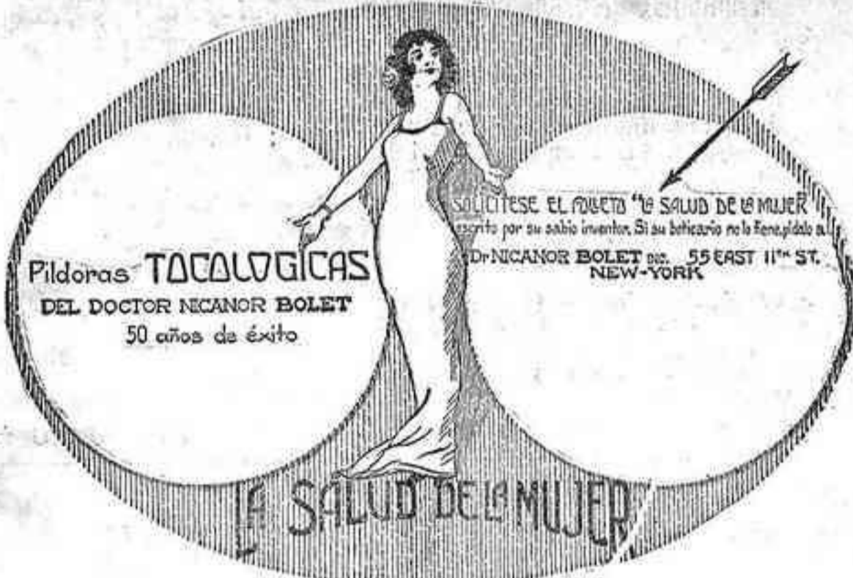
De venta en las principales Farmacias y Droguerías. Pidanse las legítimas de New York, U. S. A.

El primero de los encuentros que dicho equipo celebre será con el T. F. C., del Realejo bajo, para lo cual