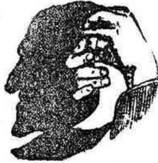
(Para sombrear en la pared) La solución, mañana.