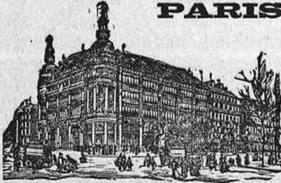
GRANDES ALMACENES DEL