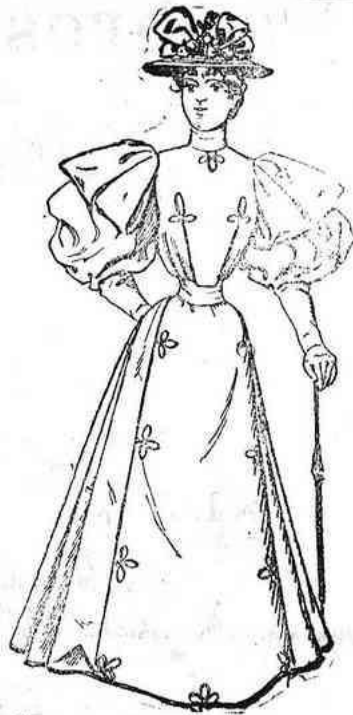
Materiales: 9 metros de lana rayada; 3 metros, 50 de seda, y tres metros de cordón para las presillas y la ruche.

Las mangas son de las llamadas «faro» y llevan sobrepuestas unas hombreras «Recamiere» de seda idéntica á la de la faja ó cinturón que guarnecen el talle.