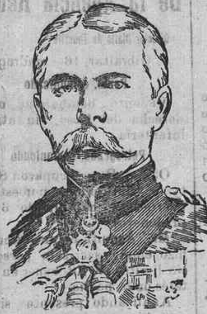
Lord Kitchener, ministro de la Guerra de la Gran Bretaña, que fué víctima del hundimiento del crucero "Hampshire"