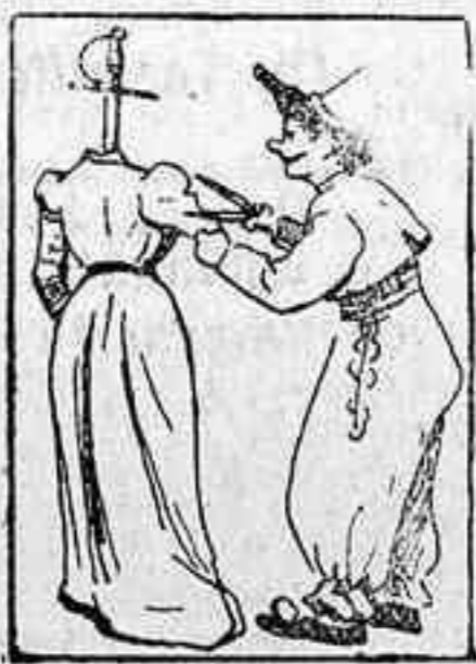
La solución, mañana.