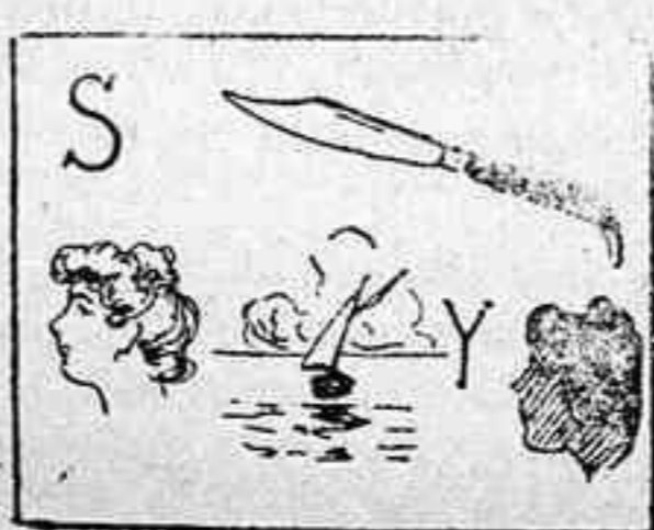
La solución, mañana.