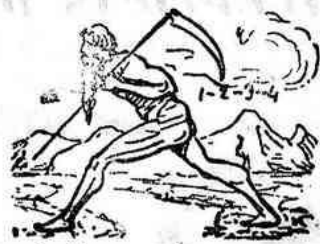
La solución, mañana.