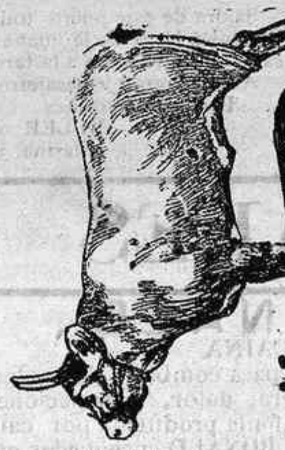
Vaca bearnesa de 3 años

La población bovina en Francia constituye un número de 255.000 cabezas. Distingúese entre ellas la raza de Urt y la vasca-bearnesa.