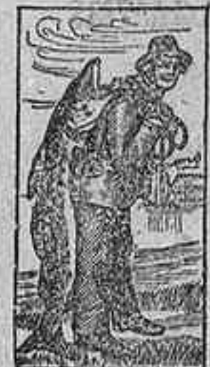
Marca de fábrica.

No es un remedio nuevo que está aún por probarse. Lo conocen favorablemente y lo recetan los principales médicos en casi todos los países del mundo desde hace más de veinte años. Esto se debe a que la Emulsión de Scott es valiosísima en todos los casos de extenuación o pérdida de carnes. La Tisis, que se consideraba incurable antes de conocerse la Emulsión de Scott, cede ahora rápidamente en sus primeros grados a la potente influencia de este medicamento. Es un maravilloso nutritivo. Con su uso los niños se desarrollan y engruesan cuando la alimentación ordinaria no les nutre en absoluto.