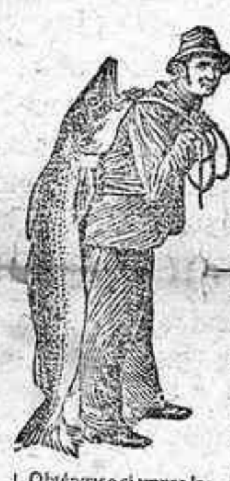
Obténgase siempre la Emulsión con esta marca "El Pescador y el pescado" del procedimiento SCOTT