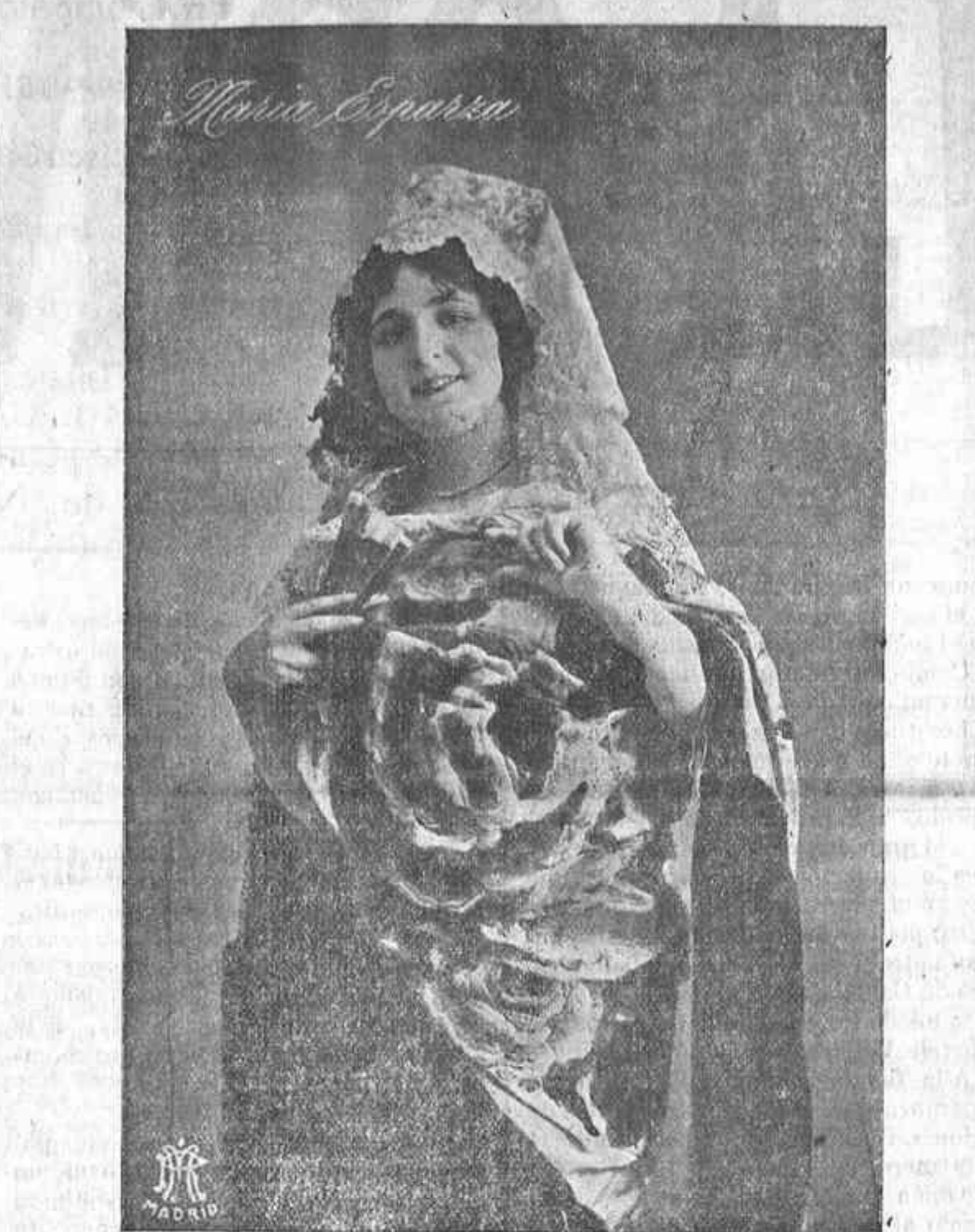
Notable bailarina que esta noche se presenta en el PARQUE RECREATIVO y de la que nos ocupamos en otro lugar.