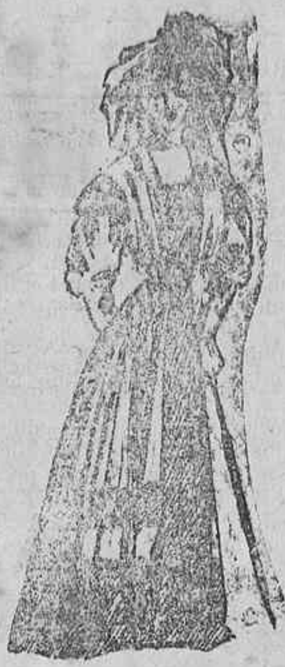
Traje para luto.—De merino. Cuerpo y falda de una pieza adornados uno y otra con anchas cenefas de crespon. Manga ancha con puño a to. Cinturón de seda. Sombrero de paño adornado también con crespones.