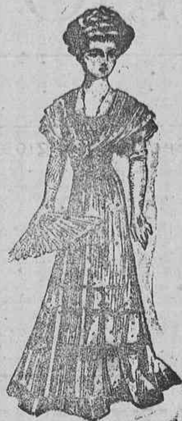
Traje para soiree.—De gasa con topes. Gran descote. Sobre el cuerpo y de la misma gasa, elegantes bandas plegadas y sujetos sus extremos bajo el pecho por una hermosa flor artificial. Sin mangas. Falda con cuatro cenefas de terciopelo negro, de menor á mayor su anchura.