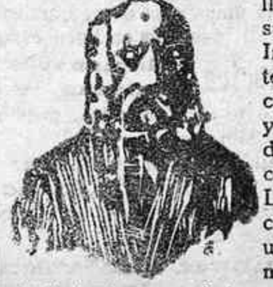
A. Charles Lambert—Paris. Depósito general Calle Balmes número 106.

El eminente doctor Charles Lambert, de París, después de un profundo estudio sobre las enfermedades venéreas y sífilíticas ha encontrado el medio de curarlas radicalmente, no solo sin hacer uso del MERCURIO, sino que combate las enfermedades contraídas por el uso de dicha sustancia. El tratamiento es sencillísimo y las fórmulas son puramente vegetales, pues en su composición solo entran hierbas minerales de la India. Estas fórmulas las presenta en las formas siguientes: Las Píldoras Charles Lambert, que curan las purgaciones, estrecheces de la uretra, flujo blanco de la muger, y gota militar. La Inyección Charles Lambert, que debe de usarse al mismo tiempo que las píldoras para que la curación sea más radical y pronta. El Elixir Charles Lambert es un gran medicamento, eficazísimo para la completa destrucción de todo bacilo sífilítico. Con su uso se purifica la sangre impura, dejándola en su estado normal, libre de todo virus, dando salud e inmunidad para evitar la reproducción de tan terrible enfermedad. Este Elixir debe de tomarse como complemento del tratamiento, una vez que los efectos, ó sea la purgación haya desaparecido. Precio de las Píldoras, pesetas 4'50, La Inyección, pesetas 3'80 y el Elixir 3'80.—De venta en Santa Cruz de Tenerife (Canarias), en la farmacia de Serra, calle del Castillo número 7. Para cualquier duda que se presente consúltese por escrito al inventor, calle Balmes, 106, Barcelona.