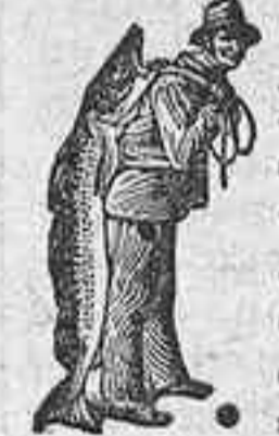
Una muestra gratis le será enviada por D. Carlos Maré, Calle de Valencia 333, Barcelona á cambio de 75 cts. en sellos para el franqueo.

Se ofrece una planchadora bien en su casa ó á domicilio. También se ofrece para apuntar ropa ó para el servicio de una buena casa. Buenos informes: Dirijirse: Cairasco núm. 1.