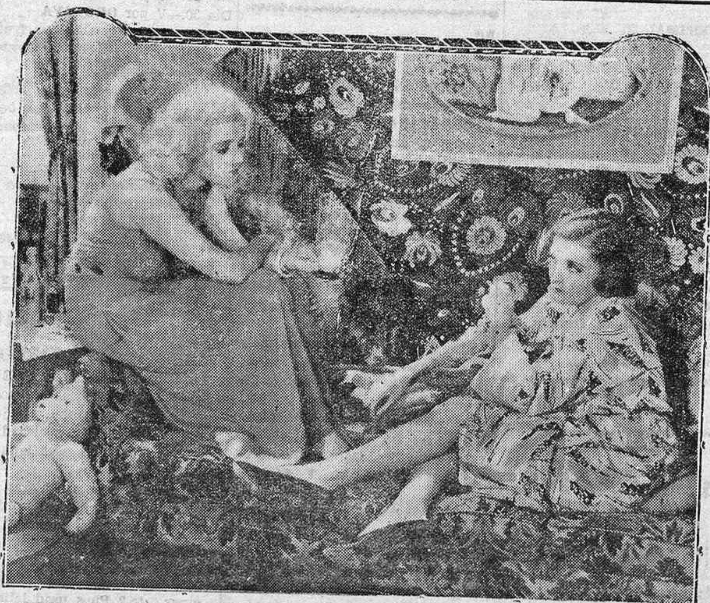
UNA DE LAS MAS DESTACADAS ESCENAS DE UNA PELICULA DE RECIENTE GRAN EXITO MUNDIAL

Sus atrevimientos en la escena y sus licencias en el vestir, hicieron de Mae West, la figura de actualidad en los Estados Unidos. Las ligas moralistas, firmes en su cruzada vetaron a la rubia traviesa y rodearon sus actuaciones de cortapisas. Un boicot en toda la regla empalidecía y aminoraba su popularidad.