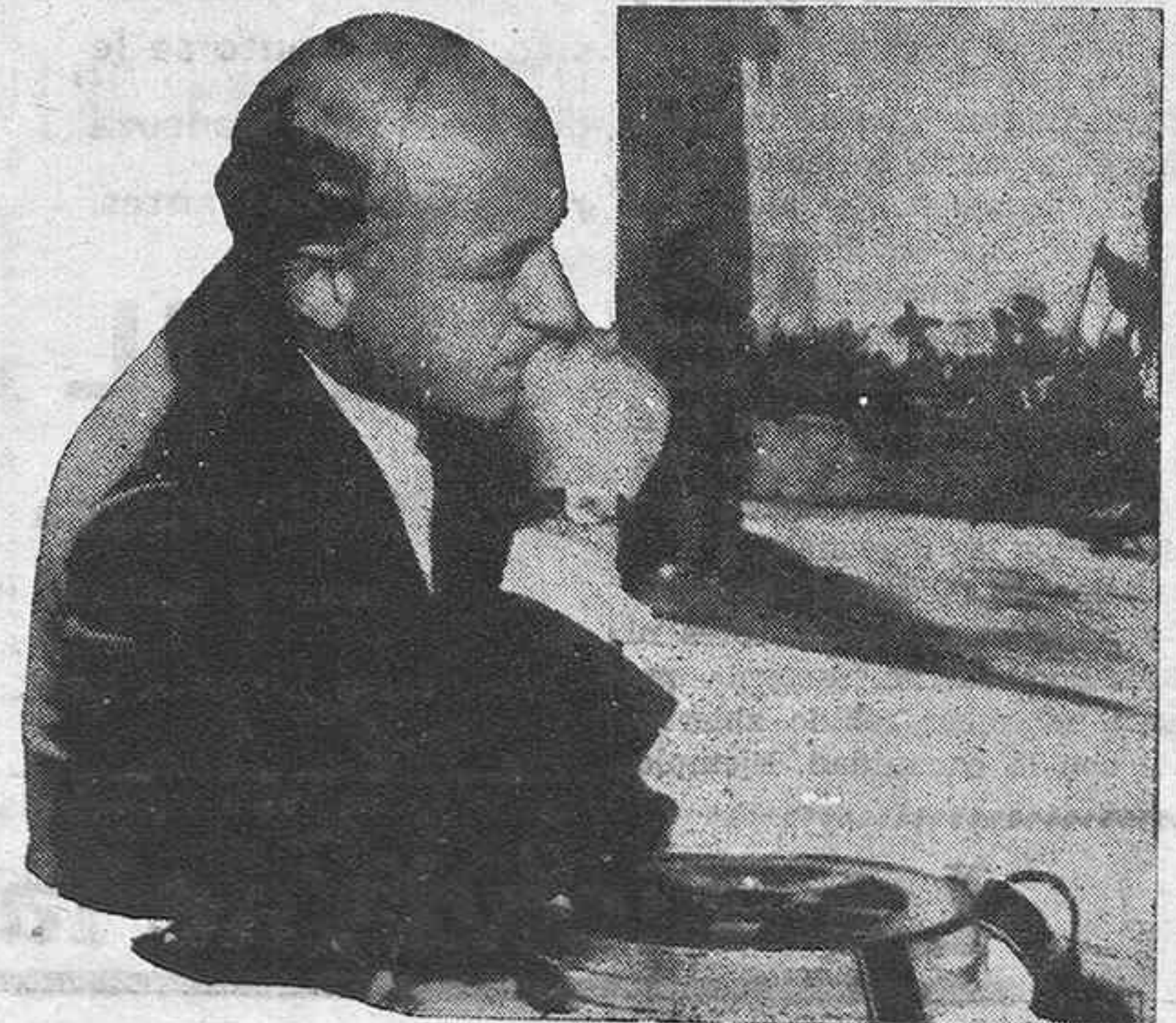
Presentamos en la foto a Cecile B. de Mille, uno de los directores de escena de los estudios americanos de más sólido prestigio, cuya última producción "El signo de la Cruz", le ha proporcionado un nuevo triunfo.