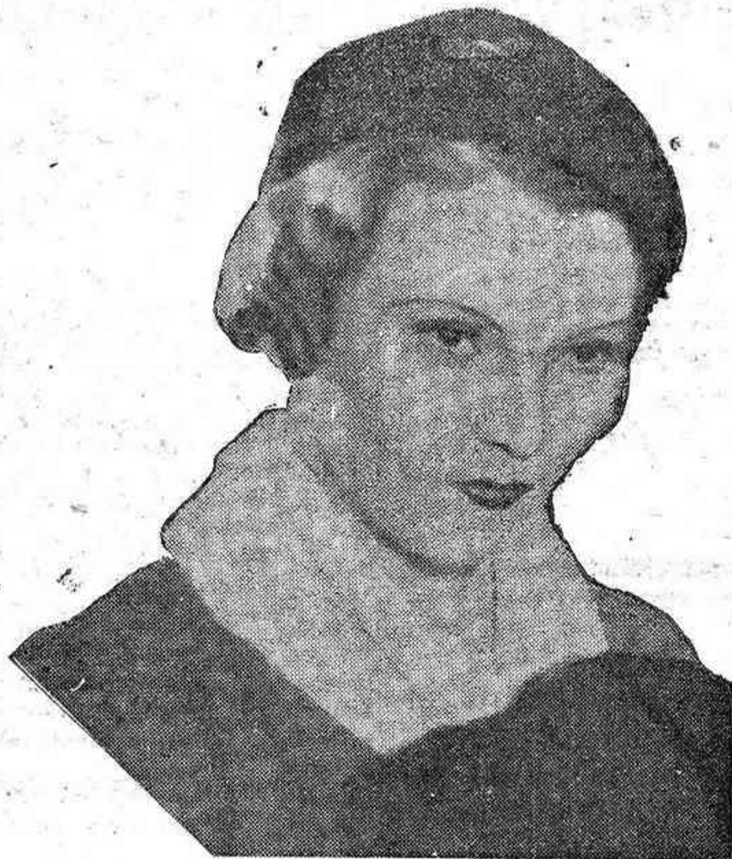
Los franceses van logrando descubrir valores nuevos en su pantalla. He aquí a Annabella, la celebrada actriz que ha conquistado ruidosísimos triunfos y que marcha a Alemania a impresionar algunas cosas para los germanos.