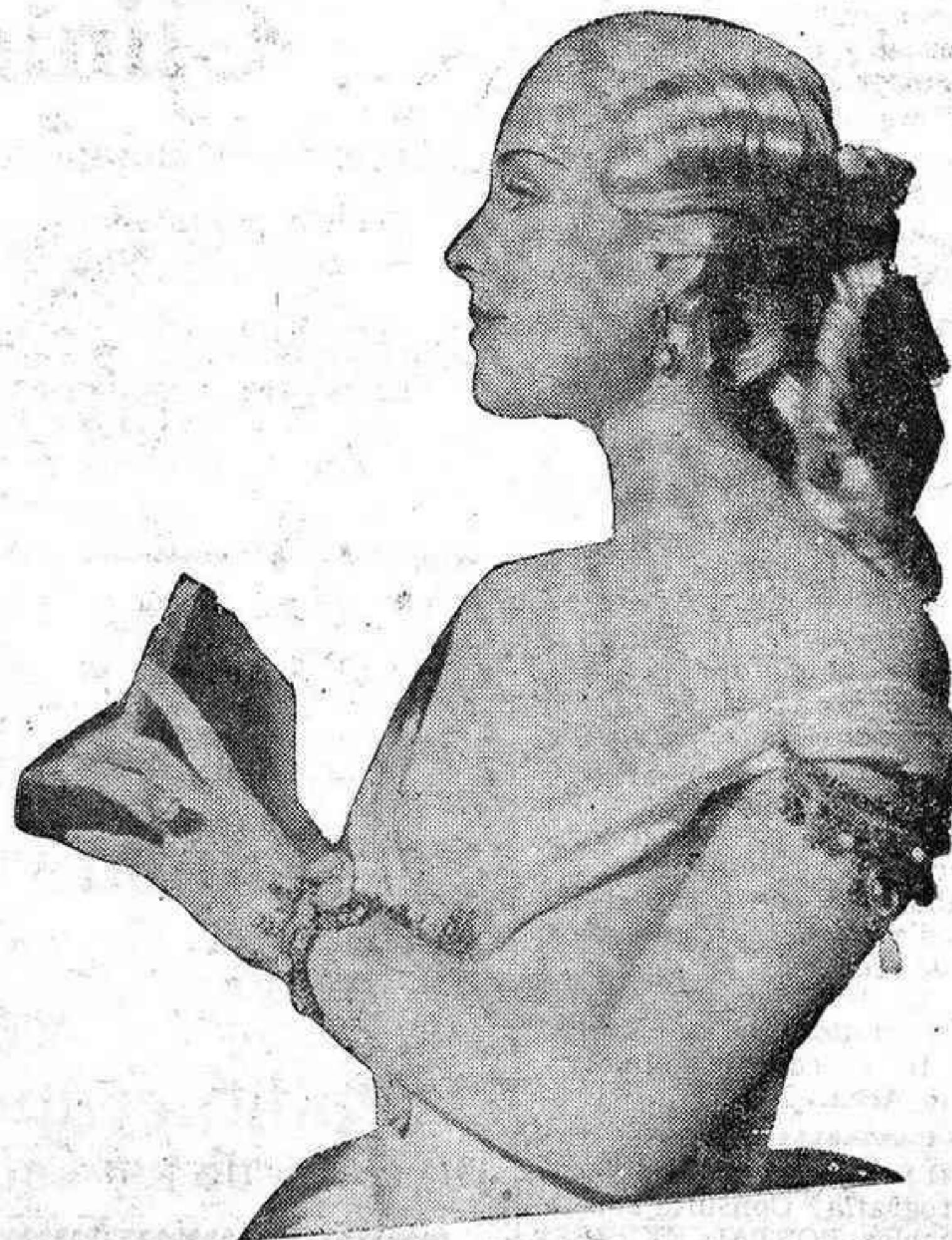
A pesar de su belleza y de su gloria, Norma Shearer no abandona a su marido en estos momentos, en que dolencia grave le hace venir a Europa. Norma ha dejado los estudios, uniéndose al compañero de su vida para cuidarle y atenderle.