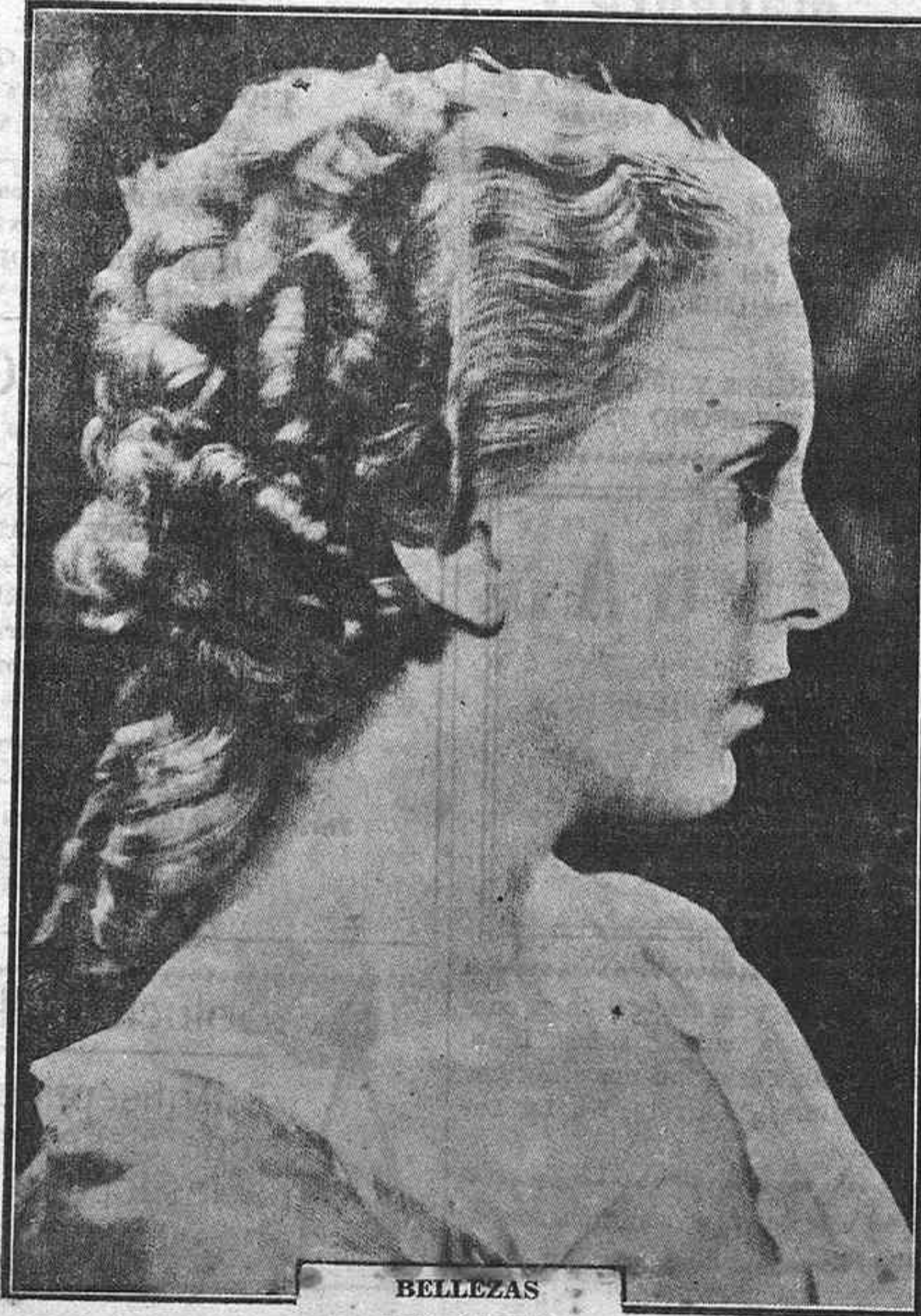
BELLEZAS DEL CINEMA

El estruendo de una hora, cegó al infortunado galán que quiso escalar la luna con la nueva fama ganada. Pero bien pronto el desengaño mató sus ilusiones. La casa editora le condenaba a una ociosidad perpétua. Era un mal negocio enrolarlo en un film.