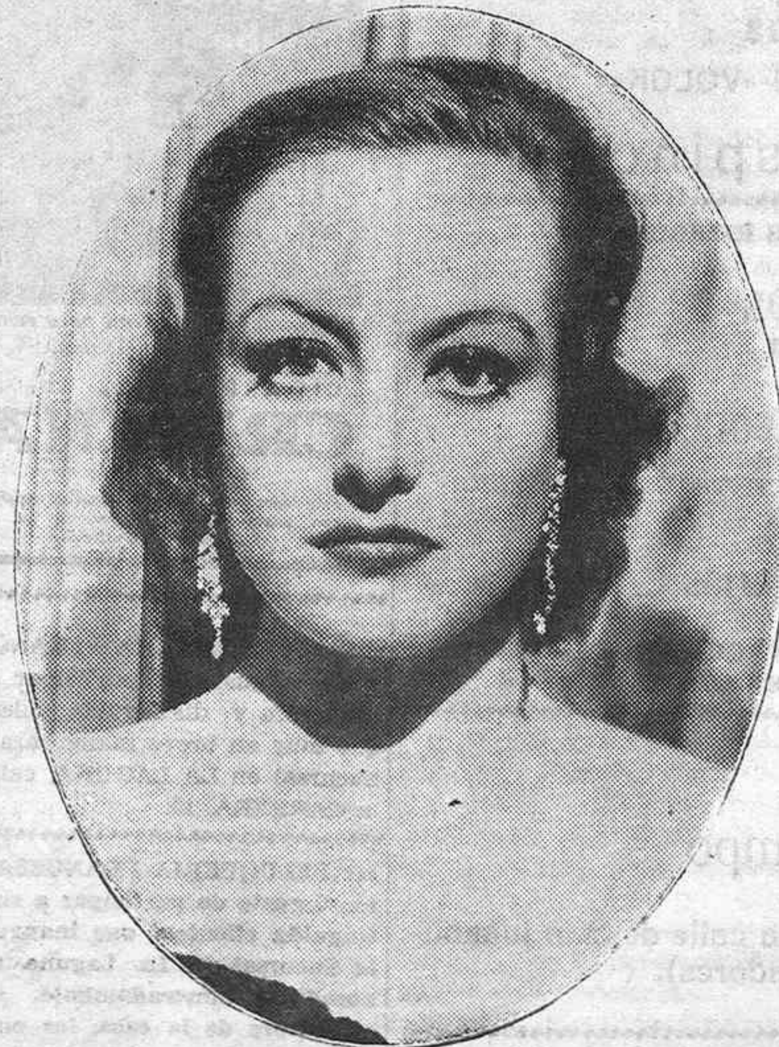
BELLEZAS DEL CINEMA