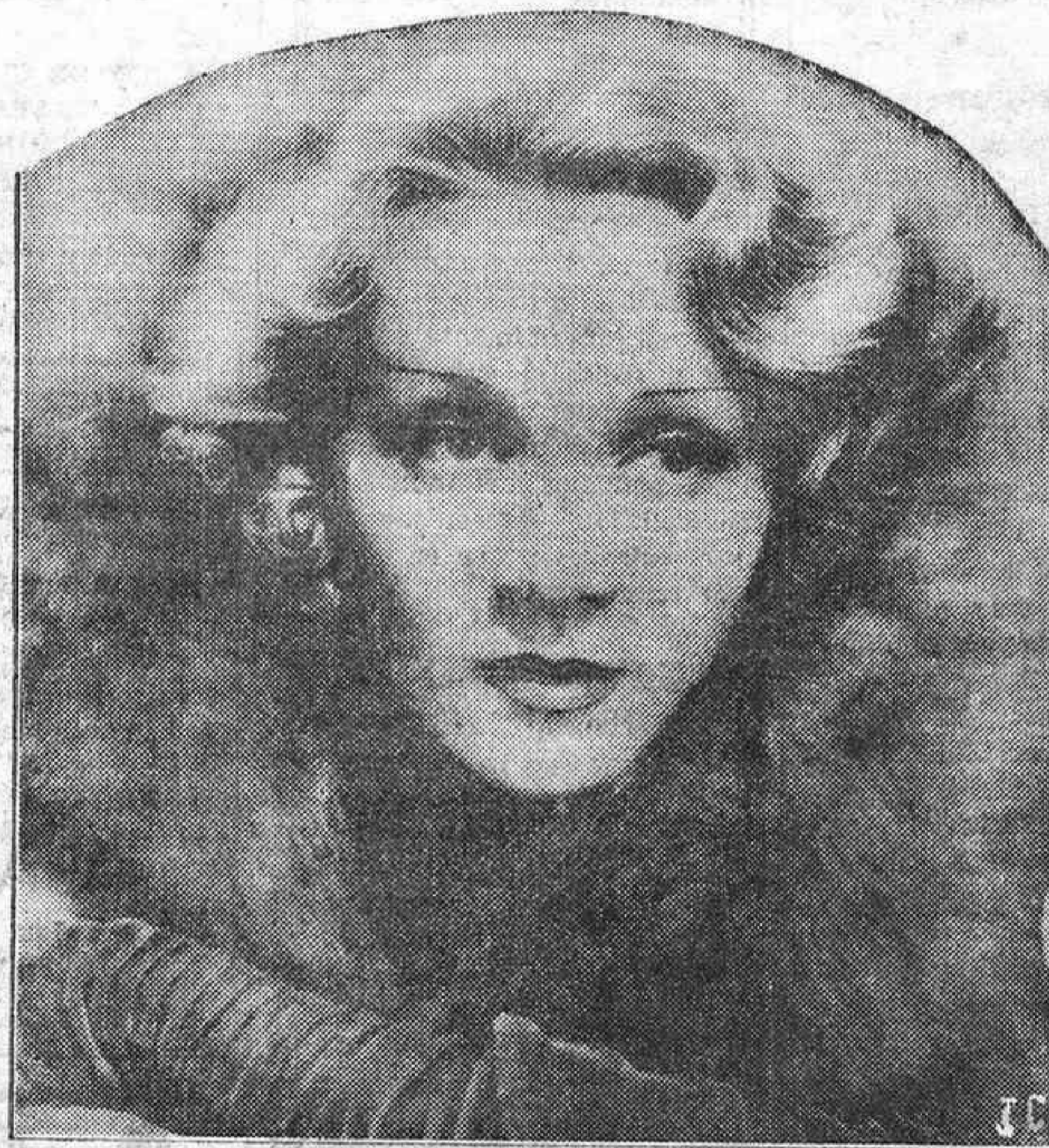
UNA DE LAS BELLAS ARTISTAS QUE TRIUNFAN EN EL CINEMA

—Para uno de los más importantes "roles" de "El capitán odia el mar", que dirigirá Lewis Milestone, ha sido contratado el famoso actor Victor Mc Laglen.