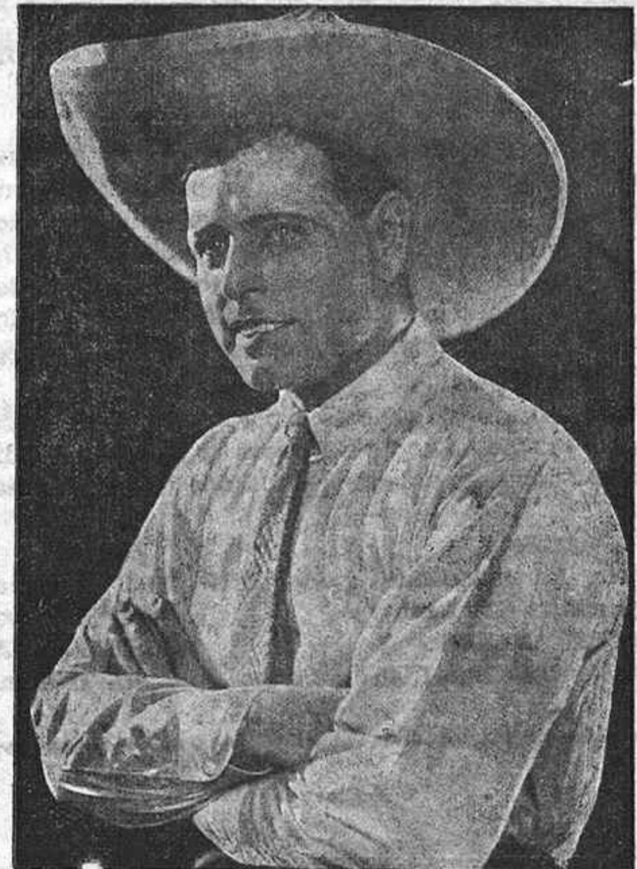
Bob Custer, de gran reputación en el Arte cinematográfico

LOS FORROS para frenos que no llevan la palabra FERODO, no son forros FERODO.