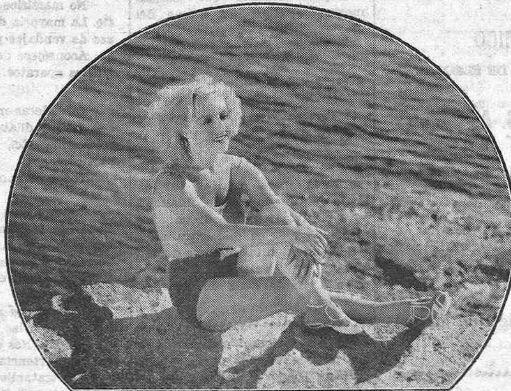
LA NOTABLE "ESTRELLA" SANDRA RAVEL