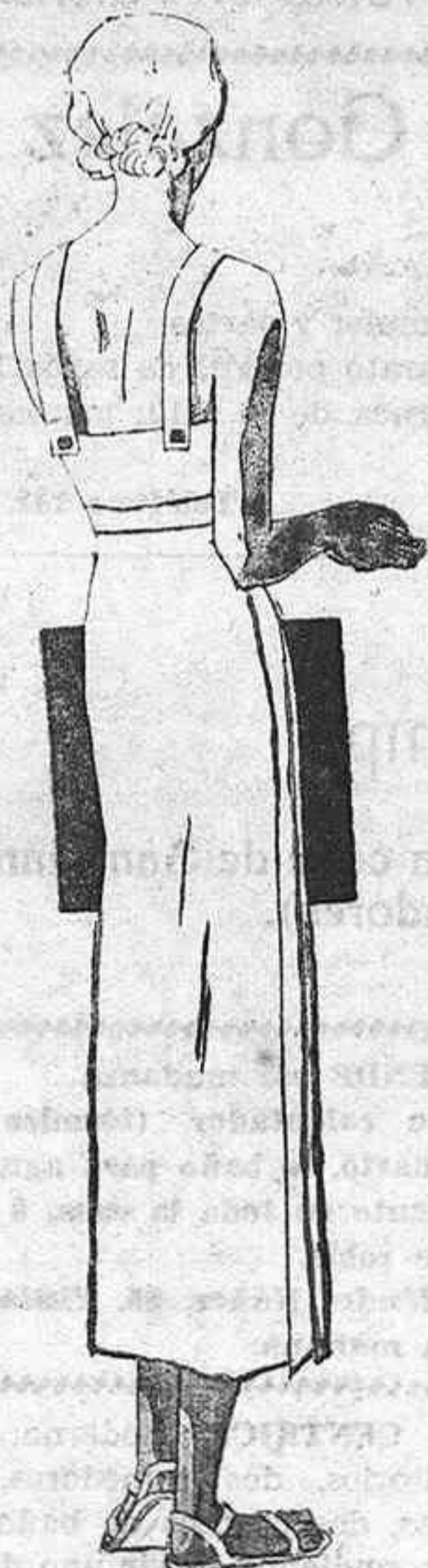
BLUSAS DE AHORA

ocasión para prescindir de los manteles ya que la boga de los pequeños mantelitos ha ocupado preferentemente el gusto de nuestras damas y un derecho en toda mesa que siga los cambiantes y alteraciones de la novedad.