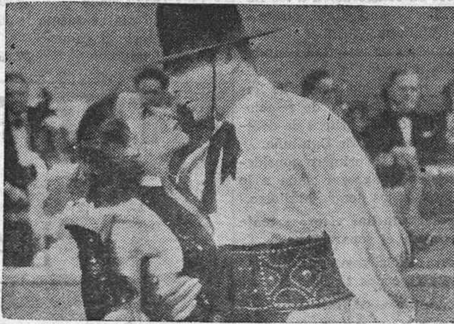
VUELVE LA MEJICANA

Apartemos a los directores de la tramoya: los socialistas. En el declive a que les han precipitado sus prédicas y sus actos anarquizantes, hoy recogen, en forma de bajas y de decepciones, la cosecha revolucionaria que pretendían almacenar en sus graneros para apoderarse, fuera como fuese, del Gobierno. A la descomposición de sus núcleos campesinos corresponde la desarticulación de sus mesnadas urbanas. Su Lenin, carlacontecido, se ha esfumado de la actuación política que desarrollaba; el ex presidente de las Constituyentes no da fe de vida; el señor De los Ríos se ve obligado a reconocer en las Cortes—en una de las últimas sesiones—que procedió en