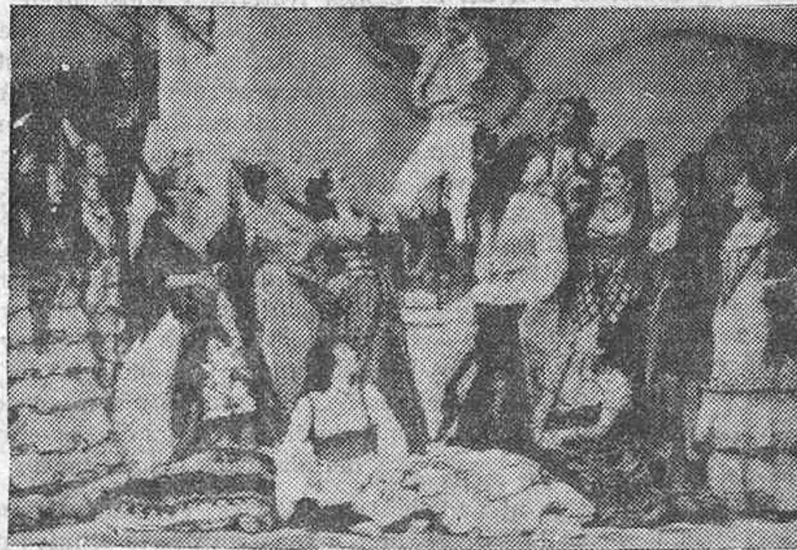
LA VIDA DE DON JUAN

En este caso la cuestión era muy compleja. Había que determinar qué se entiende por legislación social, según la Constitución, y cual es el campo del derecho civil; qué ha querido decir la Constitución al hablar de bases contractuales, qué extensión tienen las palabras política y acción social agraria con-