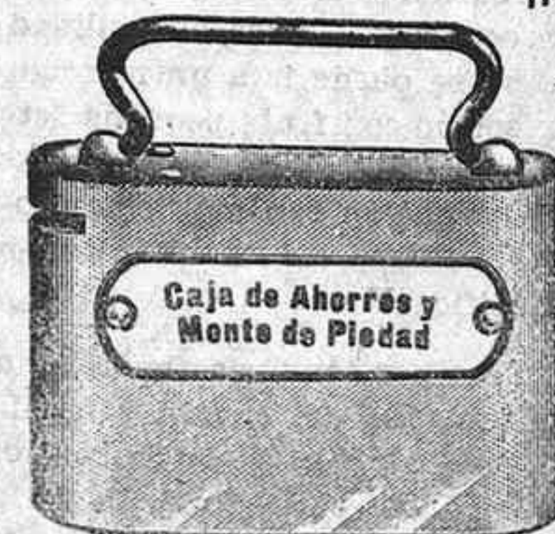
Caja de Ahorros y Monte de Piedad