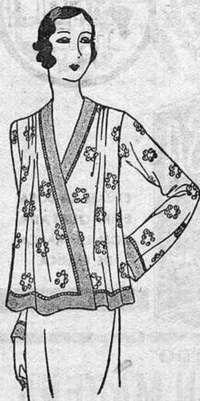
MATINE EN TELA DE SEDA PARA LA CASA

Los quehaceres de la casa exigen una prenda cómoda y esta es el matiné de seda con incrustaciones en el tejido. Las mangas ensanchadas hacia abajo. El talle en forma. Bandas en seda de color diferente, al sesgo.