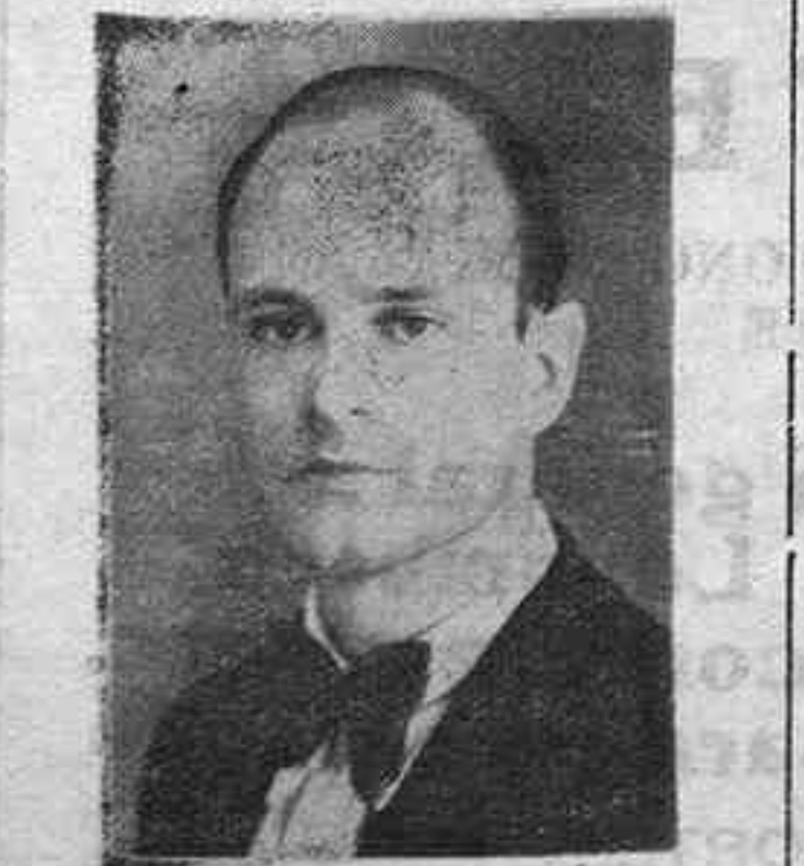
Viaje a la Península el capitán del Cuerpo Jurídico y Delegado de

A bordo del vapor de la Trasméditerránea "Romeu", hizo anoche