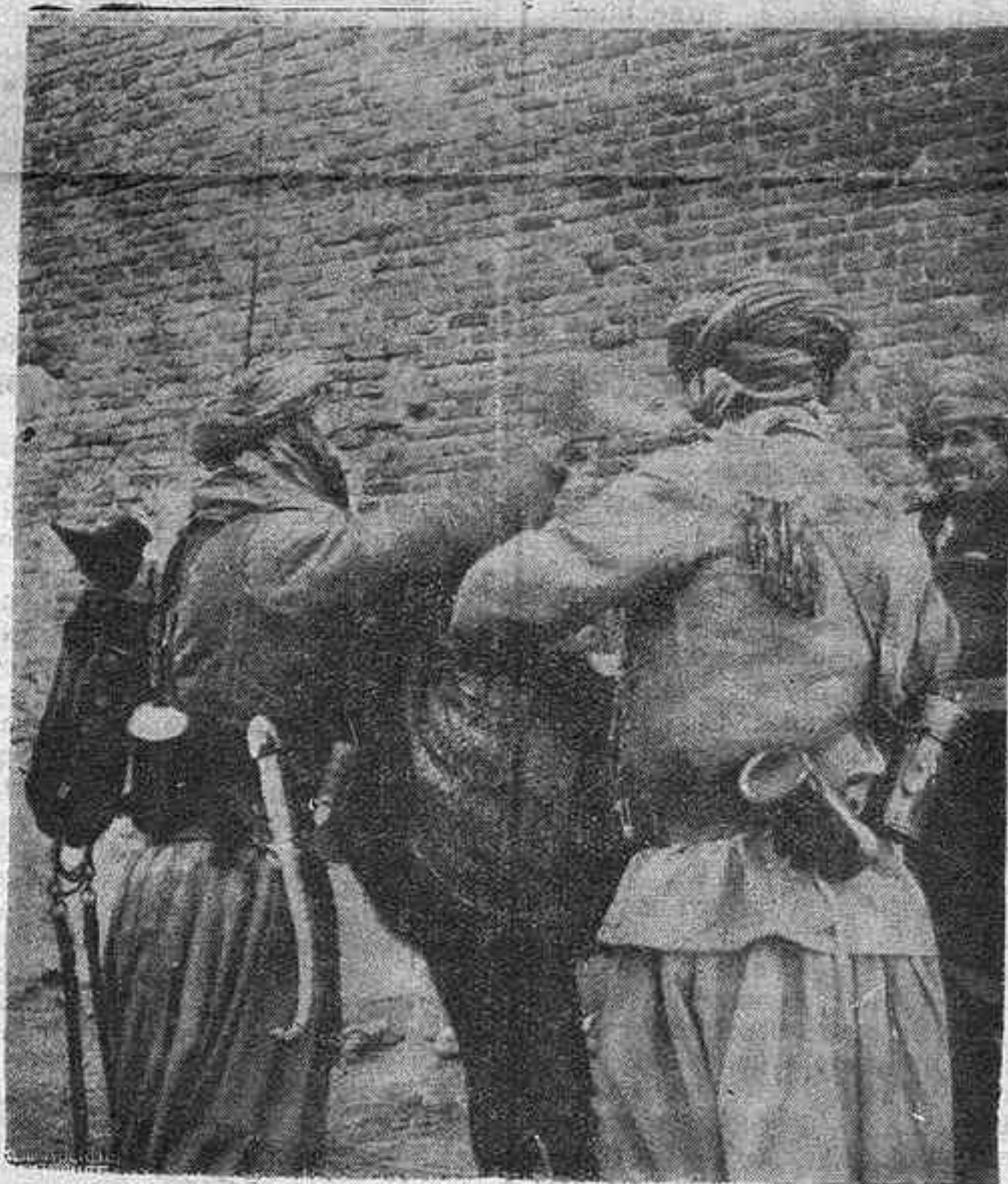
Curiosísimos tipos orientales del Ejército Nacional fotografiados en el frente de Madrid, mientras examinan el contenido de una caballería tomada al enemigo: uno de ellas ostenta una riquísima daga que contrasta con el moderno estuche de sus gemelos de campaña

Dos meses se habían cumplido, y por fin una mañana, tras una nube de polvo, acercóse un comisario. Con él venía solo, su brioso y negro caballo. —¿Dónde está tu señor, dime, dónde el dueño de mi alma? —Mira aquí, señora mía, lo que para ti dejara... Y mostróme un paño blanco, lle-