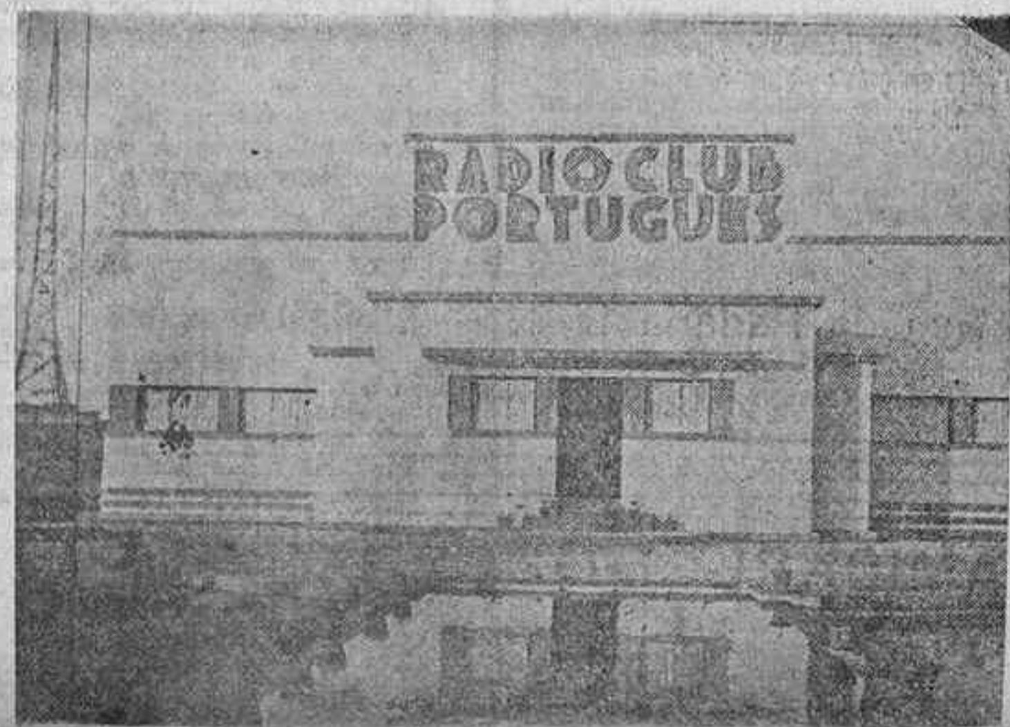
ESTA FOTO NOS PRESENTA EL EDIFICIO EN QUE SE ENCUENTRA INSTALADA LA EMISORA DEL RADIO CLUB PORTUGUES, CUYAS CAMPANAS EN PRO DE LA CAUSA NACIONALISTA ESPAÑOLA NO ES TAN CONOCIDA Y POR LAS CUALES SE HA HECHO MEREDECOR AL HOMENAJE CORDIALISIMO DE TODOS LOS BUENOS ESPAÑOLES

La sentencia a muerte en Rusia contra un ingeniero alemán levanta olas de indignación en Alemania.—"Es un reto al mundo entero."—"En pleno rostro de Europa"—dicen los periódicos