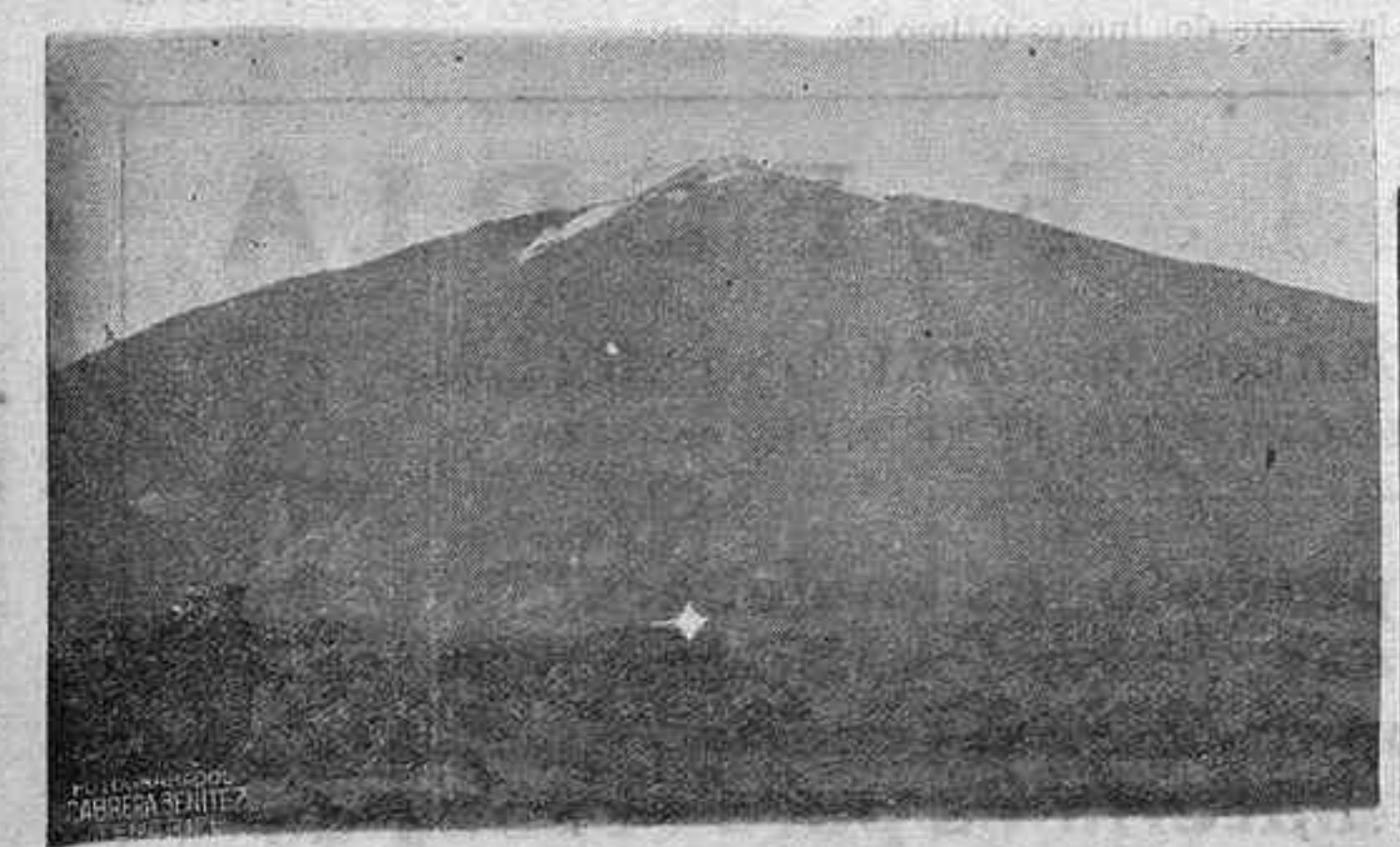
ASPECTO QUE OFRECE EL TEIDE HACIA EL SUR. EN EL PUNTO MARCADO SE ERIGIRA EL MONUMENTO MAS ALTO DE ESPAÑA AL GENERALISIMO FRANCO