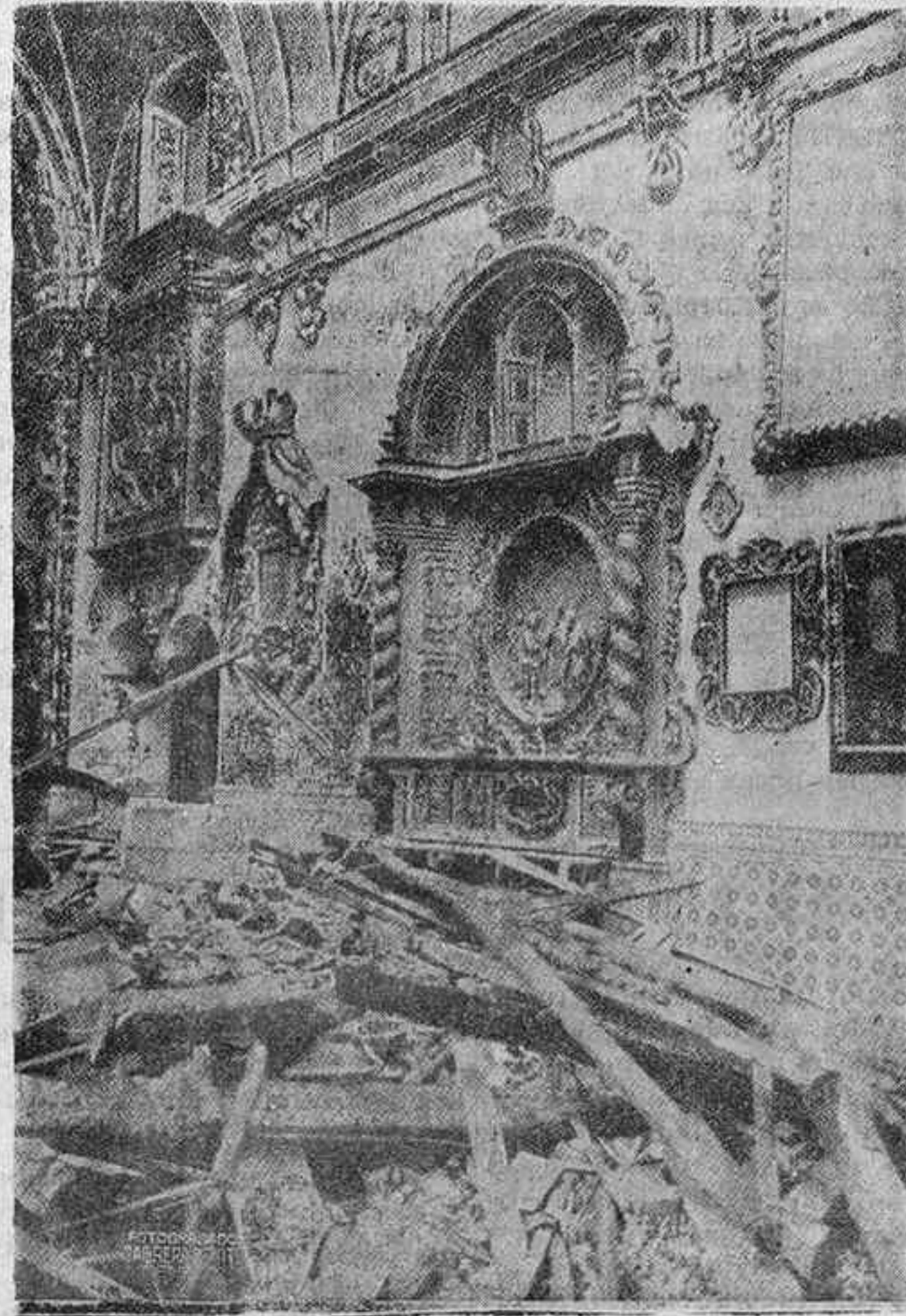
LA GUERRA CONTRA LA RELIGION CRISTIANA EN ESPAÑA. EDIFICIOS MARAVILLOSOS Y HERMOSAS OBRAS DE ARTE SON REDUCIDOS A MONTONES DE ESCOMBROS POR INDICACIONES DEL "TALMUD" Y DE LOS "PROTOCOLOS"