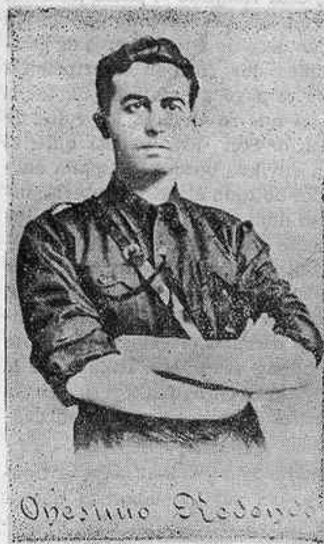
Onésimo Redondo, jefe territorial de la F. E., en Valladolid, don Onésimo Redondo, hombre joven que fué encarcelado por los del Frente Popular.