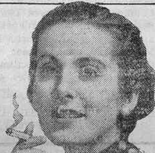
Cigarrillos 100 por 100 Virginia

Sin discusión: Craven "A" no perjudican a la garganta.