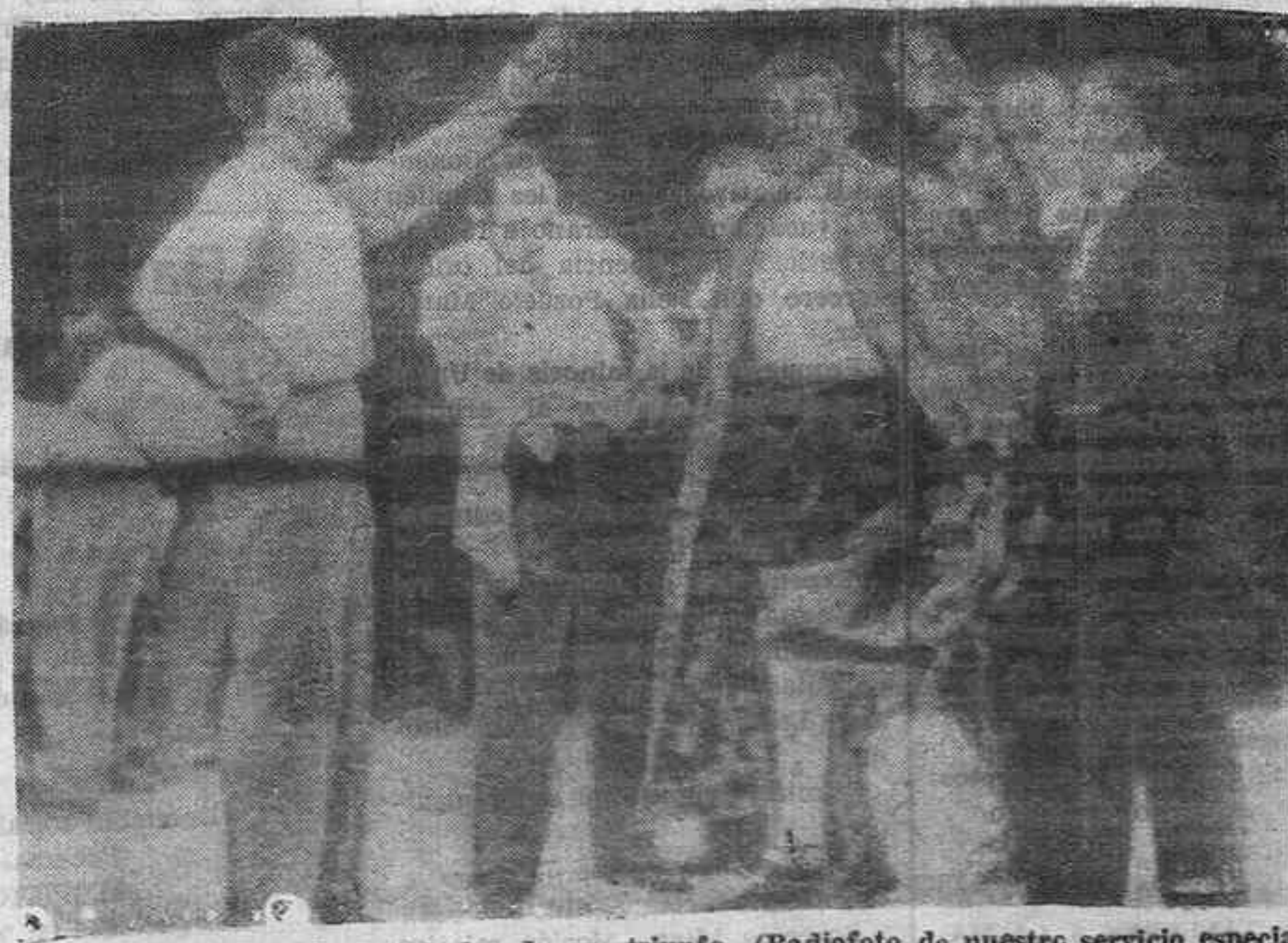
Max Schmeling sonríe satisfecho de su triunfo.