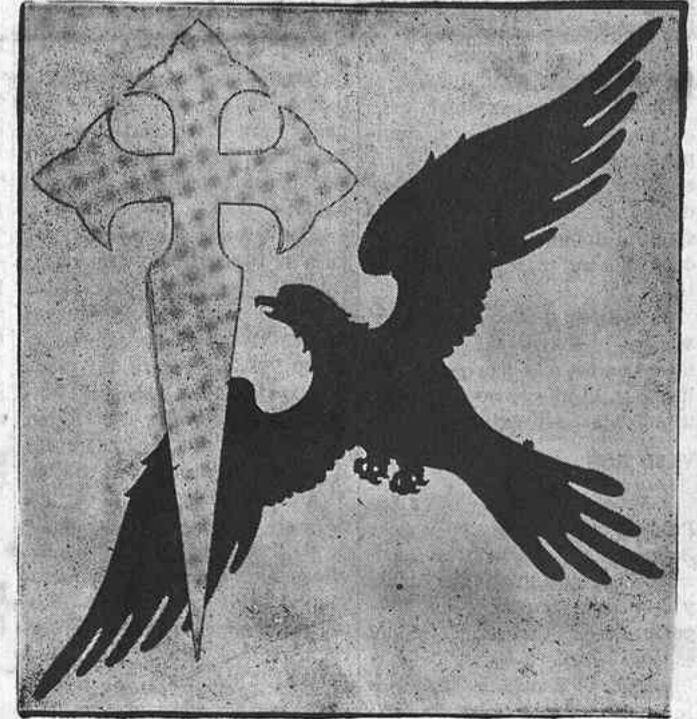
LA CRUZ DE SANTIAGO Y EL AGUILA DEL IMPERIO

Hoy, a las nueve y treinta de la mañana (hora de Canarias) Radio Nacional de España retransmitirá el acto de la ofrenda al Apóstol Santiago, que tendrá lugar en la Basílica de Santiago de Compostela, donde reposan los restos del Apóstol, Patrón de España.