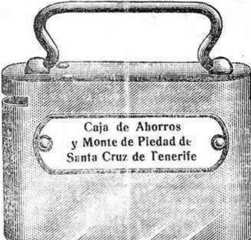
Caja de Ahorros y Monte de Piedad de Santa Cruz de Tenerife

La falsificación de monedas dentro del Estado Pontificio será castigada por las leyes.