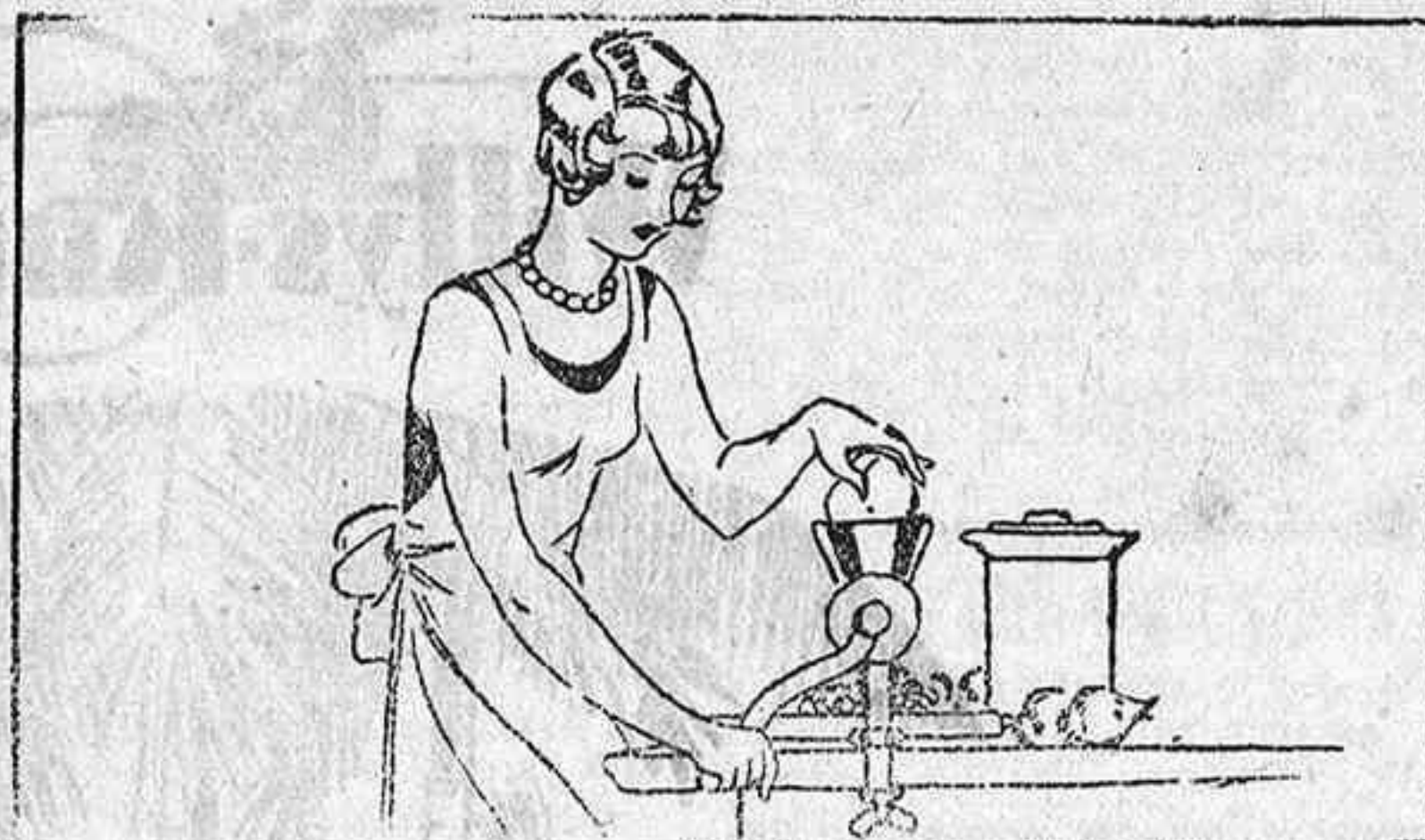
La maquina de picar carne, facilitará vuestro trabajo

Para cuatro personas he aquí un plato sabroso, de grata satisfacción para el paladar y de un gran valor alimenticio. Se trata de la merluza a la langosta. Poner atención que os vamos a dar la fórmula.